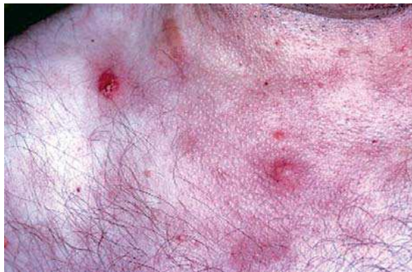
Figura 1. Lesões nodulares do tronco com pseudovesiculação.