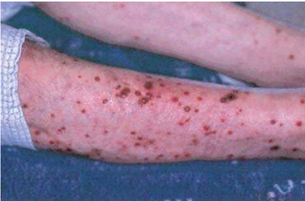
Figura 2. Lesões purpúricas dos membros inferiores.

as formas “para-inflamatória” e gravídica na idiopática[3]. A forma clássica caracteriza-se pela presença de múltiplas lesões papulo-nodulares, de distribuição assimétrica, predominando na face, pescoço e membros superiores, raramente envolvendo o tronco e membros inferiores. Apresentam caracteristicamente uma tonalidade eritematoviolácea sendo a superfície bosselada (pseudovesiculosa), por vezes com bolhas e pústulas. As lesões tendem a coalescer formando placas de dimensões variadas, discretamente dolorosas e não pruriginosas. A dermatose cursa habitualmente com febre, alterações do estado geral, neutrofilia e aumento da velocidade de sedimentação[4]. Histologicamente a característica dominante é o marcado infiltrado dérmico rico em neutrófilos com carioclasia mas sem sinais francos de vasculite[1, 2]. Em alguns casos verifica-se um envolvimento extracutâneo[3, 5, 6] nomeadamente ocular, muscular, articular, pulmonar, bucal, genital, renal, hepático, digestivo, ganglionar, cardiovascular e do sistema nervoso central. A maioria melhora espontaneamente em um a três meses. A corticoterapia oral induz a resolução rápida do processo inflamatório cutâneo e sistémico, podendo ocorrer uma ou mais recidivas[3, 5] em cerca de 30% dos doentes. Apesar da ausência de marcadores indiscutíveis formularam-se critérios orientadores do diagnóstico[2] (Quadro II).