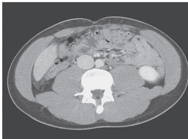
Figura 1. Na TC abdominal é evidente a hepatomegalia homogénea, numa altura de corte onde normalmente não se observa tecido hepático na ausência de ptose do fígado

Figure 1. Abdominal CT scan shows homogeneous hepatomegaly at a height of the cut where hepatic tissue is not normally seen without hepatic ptosis