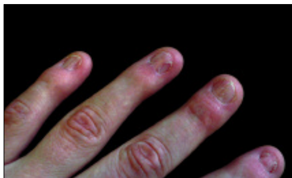
Figura 1. Distrofia ungueal.

Caracteriza-se por distrofia ungueal congénita