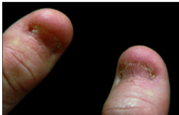
Figura 2. Distrofia ungueal.