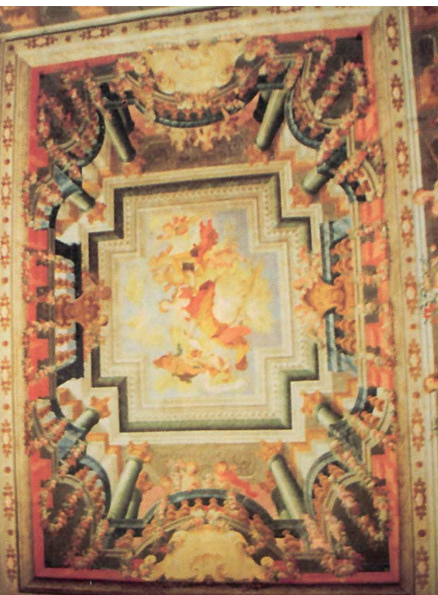
TECTO DA BIBLIOTECA DA FACULDADE DE MEDICINA DE COIMBRA