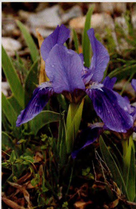
Lliri menut ( Iris lutescens ).

Semblant al lliri blau, però més petit en totes les seues parts, i amb tiges floríferes simples, amb 1 a 2 flors d'un blau violaci més o menys intens o groguenques, molt rarament blanques, lleugerament flairoses. Es distribueix per la regió mediterrània occidental, tot i que és escàs en el nord d'Àfrica. Forma part d'herbassars vivaços i matolls, principalment en substrats secs de naturalesa bàsica, sovint pedregosos o d'escassa profunditat, ocasionalment en roquissars, d'ordinari en àrees assolellades, no massa plujoses. Floreix de març a maig, i pot allargar la floració fins al juny en zones de muntanya.