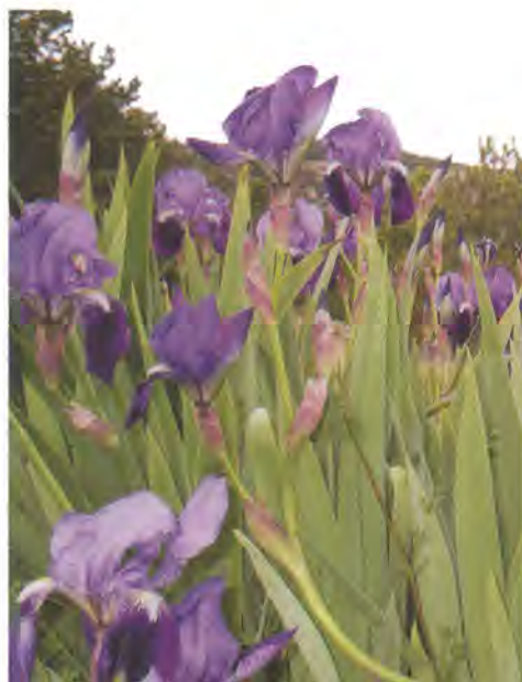
Lliri blau ( Iris germanica ).

És conegut també per les seues propietats medicinals. Les fulles d'aquestes plantes són molt riques en vitamina C i bioflavonoids; del rizoma sec s'obté