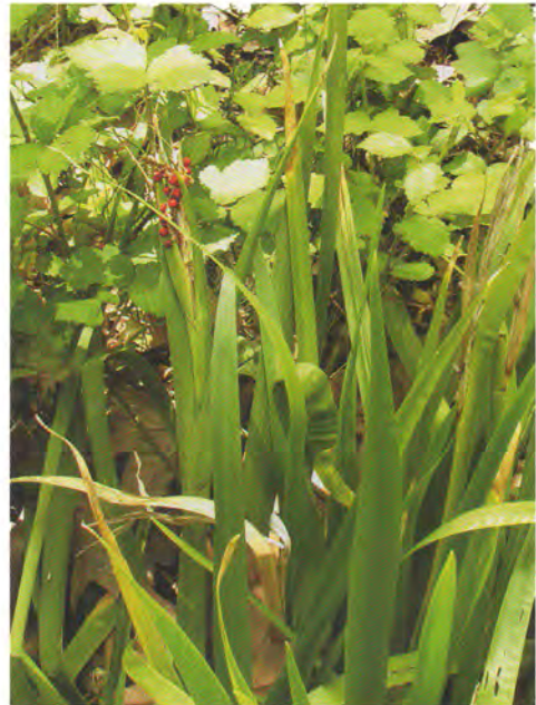
Lliri pudent ( Chamaeiris foetidissima ).

Com l'espècie precedent, es troba inclòs a l'annex II del Decret 70/2009 i Orde 6/2013 pels quals es regula el Catàleg Valencià d'Espècies de Flora Amenaçades, com a espècie protegida no catalogada.