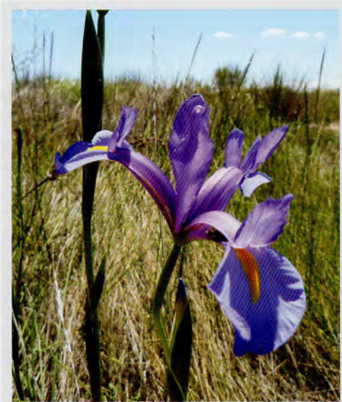
Lliri ginjol ( Xiphion vulgare ).

Herba bulbosa, amb fulles linears i canaliculades, presents a l'hivern, i tija amb 1-2 flors violàcies, rarament blanques, molt poc o gens flairoses. Es distribueix pel sud-oest d'Europa i el nord d'Àfrica. Es troba en herbassars higròfils, en aiguamolls, marjals, fonts, regalims humits, clarianes de bosc i matollar, de vegades també en fenassars, en sòls de qualsevol naturalesa, de vegades pedregosos. Floreix de març a juny, encara que es pot allargar la floració fins al juliol en zones de muntanya.