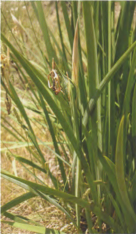
Lliri de font ( Chamaeiris reichenbachiana ).

Per la seua raresa al nostre territori, es troba inclòs a l'annex II del Decret 70/2009 i Orde 6/2013 pels quals es regula el Catàleg Valencià d'Espècies de Flora Amenaçades, com a espècie protegida no catalogada.