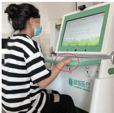
图 1 基于眼动追踪的动态任务评估设备