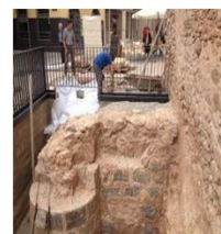
PART D'UNA TORRE I FOSSAT