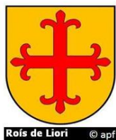
Rois de Liori