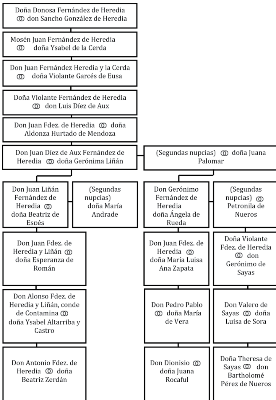
ÁRBOL 2: de los Fernández de Heredia y sus enlaces matrimoniales