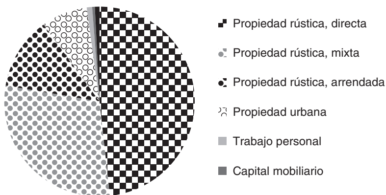
GRÁFICO 3 Distribución de la renta de la aristocracia terrateniente (1954)