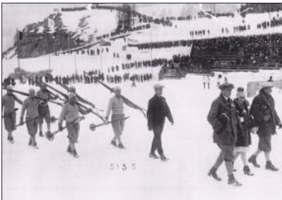
Slika 3: Švicarsko »moderno« smučarsko in teniško središče (Guček 2014).

Zgodovinarji prazgodovino smučanja uvrščajo v dolgo obdobje od prvega dokumentiranega pojava smučanja do leta 1888, letnice znamenitega uspešnega pohoda Norvežana Fridtjofa Nansena na smučeh preko prostrane ledene Grenlandije. Vse to je zapisal v svoji sloviti knjigi Na smučeh preko Grenlandije , v kateri je dokazal koristnost uporabe smuči za lažje premagovanje poti po zasneženih in ledenih ovirah. Vsi smučarski dogodki po tej letnici štejejo za obdobje športnega - modernega smučanja, torej drugega obdobja smučanja (Guček 2014). »Norveška smučka« raziskovalca Fridtjofa Nansena je postala slavna in je kmalu po uspešnem pohodu prodrla v alpske dežele ter navdušila mnoge raziskovalce in športnike. Smučarski teki, kasneje smučarski skoki in šele nato smučanje po strminah navzdol, so se zelo hitro širili in razvijali. V srednji Evropi se je smučanje pojavilo okrog leta 1800, do takrat pa so poznali le drsanje in sankanje. Norvežani so se z ladjami preseljevali v Ameriko in v Avstralijo in nekateri so s seboj jemali tudi smuči. Tako se je smučarska tehnika prenesla tudi na drugo stran oceana. Uradno naj bi se s smučanjem v Ameriki pričelo leta 1840, v Avstraliji in na Novi Zelandiji pa leta 1855. V Južni Ameriki se je med zlato mrzlico v rudarskih naseljih leta 1890 smučanje hitro razširilo (Guček 2000, 65–70).