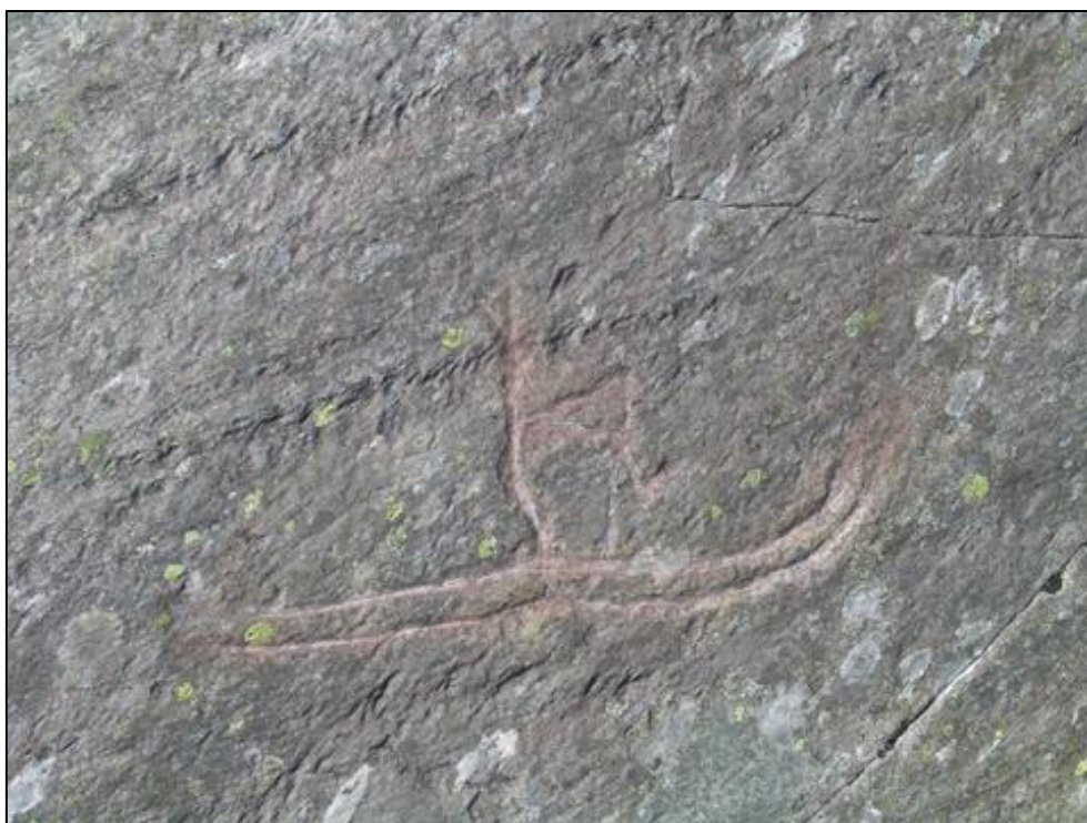
Slika 1: Petroglif, v skalo vklesana risba smučarja (Guček 2010).

Prvi primer smuči kot preprostega pomagala pri hoji, sega v obdobje kamene dobe pred več kot 8000 leti. Uporabljali naj bi jih predniki uralsko–altajskih ljudstev na območju Bajkalskega jezera v jugovzhodni Rusiji in v gorovju Altaj na severozahodu Kitajske. Začetki smučanja so zabeleženi v skalnih reliefih z upodobitvami smučarja na petroglifu, z najdbami smuči in prvimi skromnimi opisi v današnji Norveški na otoku Rodoy. Smučarja, vklesanega na arheološkem kamnu, so poimenovali »Homo skiens« (Batagelj 2009, 15–19).