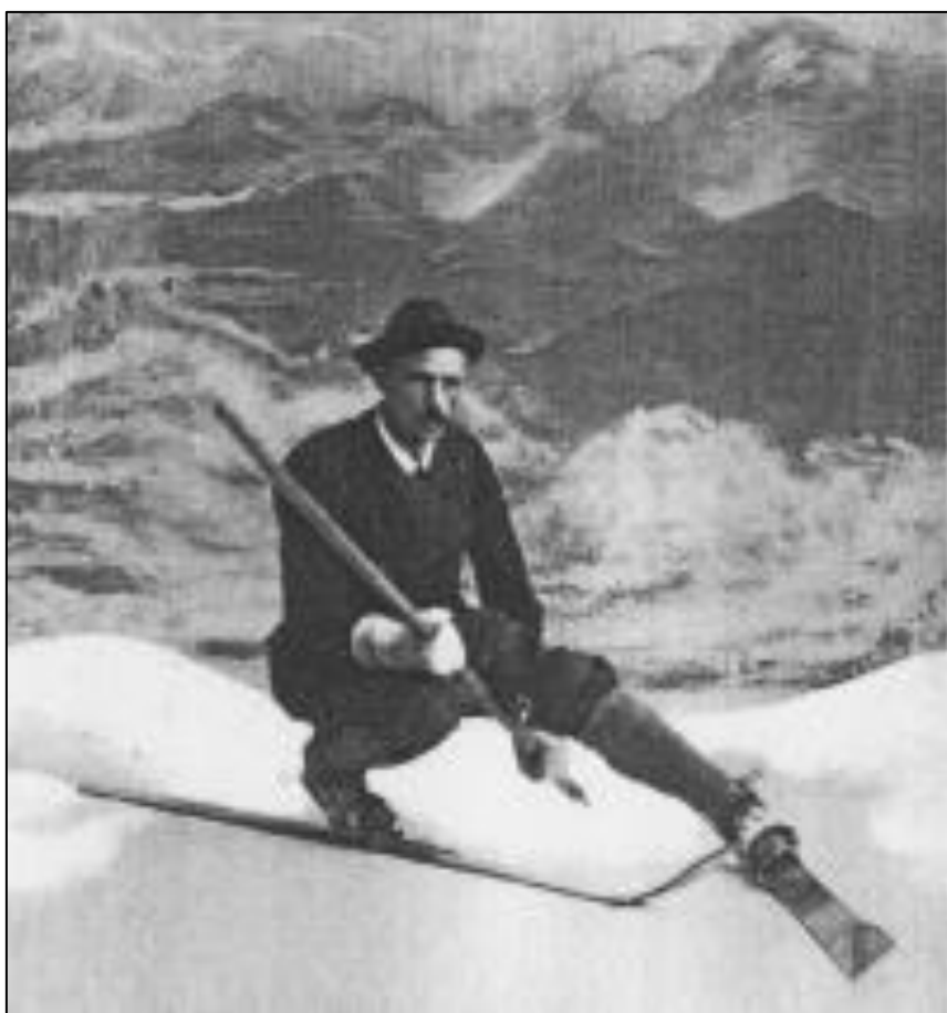
Slika 5: Lilienfeldska tehnika smučanja Mathiasa Zdarskya (Guček 2009f).

Paulcke in Zdarsky sta s svojim načinom smučanja smučanja, ki je nordijsko (skandinavsko) in lilienfeldsko (alpsko) tehniko združil in tako posegel v stalni spor o prednostih posamezne tehnike smučanja med Paulckejem in Zdarskym. Nastala je nordijsko-alpska tehnika smučanja. Poleg vsega drugega je vendarle najpomembnejša zasluga Bilgerija izpopolnitev smučarske tehnike s plužnim načinom menjavanja smeri, pri kateri je združil nordijska lika kristianijo in telemark (Denning 2015, 63–67).