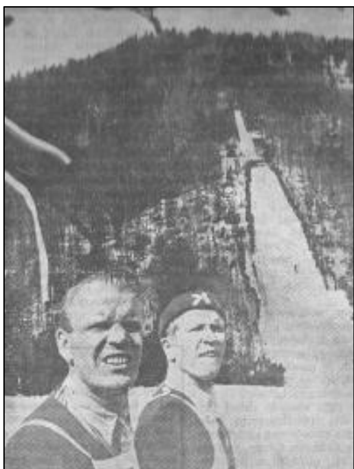
Slika 7: Tekmovanje v skokih v Planici leta 1934 na Rožmanovi velikanki.