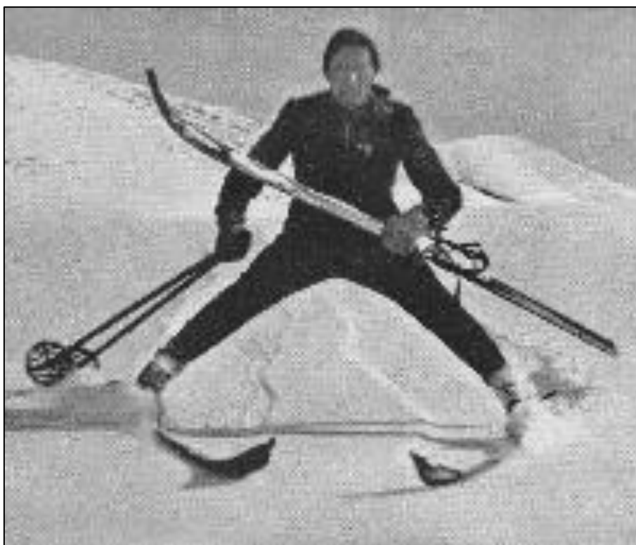
Slika 86: Arlberška tehnika smučanja (Guček 2009b).

V prvih letih po prvi svetovni vojni je zanimanje za smučanje naraščalo med vsemi sloji prebivalstva. Kot najbolj aktivno deželo na področju smučanja v nekdanji skupni državi Jugoslaviji so nas Slovence kmalu označili kot smučarski narod. Smučanje je zaradi svoje popularnosti postalo »nacionalni šport«. Zanimanje za smučanje po prvi svetovni vojni je poleg športne dejavnosti spodbudilo tudi razvoj turistične in gostinske dejavnosti. Povečala se je tudi rast industrije in gospodarskih dejavnosti, povezanih s smučanjem.