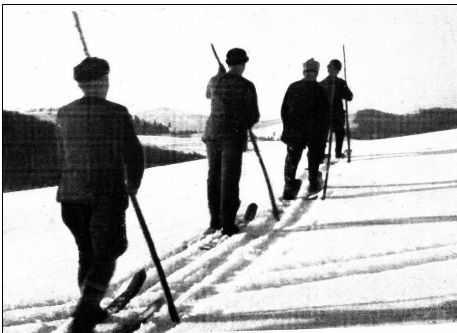
Slika 6: Bloški smučarji s starodobnimi bloškimi smučmi (Orel 1964, 64).

Batagelj (2009, 23–26) raziskuje t.i. predmoderno smučarsko dobo, kjer posebej obravnava bloško smučanje z njegovimi mitološkimi razsežnostmi. Čeprav priznava, da gre pri tem za pojav, ki je izrednega pomena za slovensko in tudi srednjeevropsko smučarsko zgodovino, argumentirano dokazuje, kako se moderno smučanje na Slovenskem ni razširilo iz Blok. Bloška smučarska tehnika in oprema sta bili izoliran tip smučanja, etnološka rariteta, ki je postala cenjena šele s pojavom modernega smučanja. Ko pa je smučanje med obema vojnama prodiralo med množice in ko je postajalo »nacionalni šport«, se je pojavila stereotipna predstava o navidezni kontinuiteti med Blokami in modernimi slovenskimi smučarji.