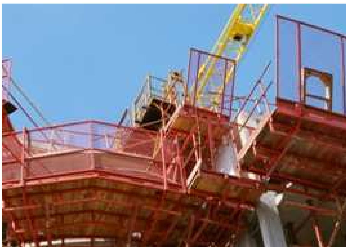
Ilustración 8: andamio en voladizo correctamente protegido.