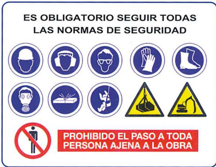
Ilustración 1: Señalización obligatoria al entrar en una obra.