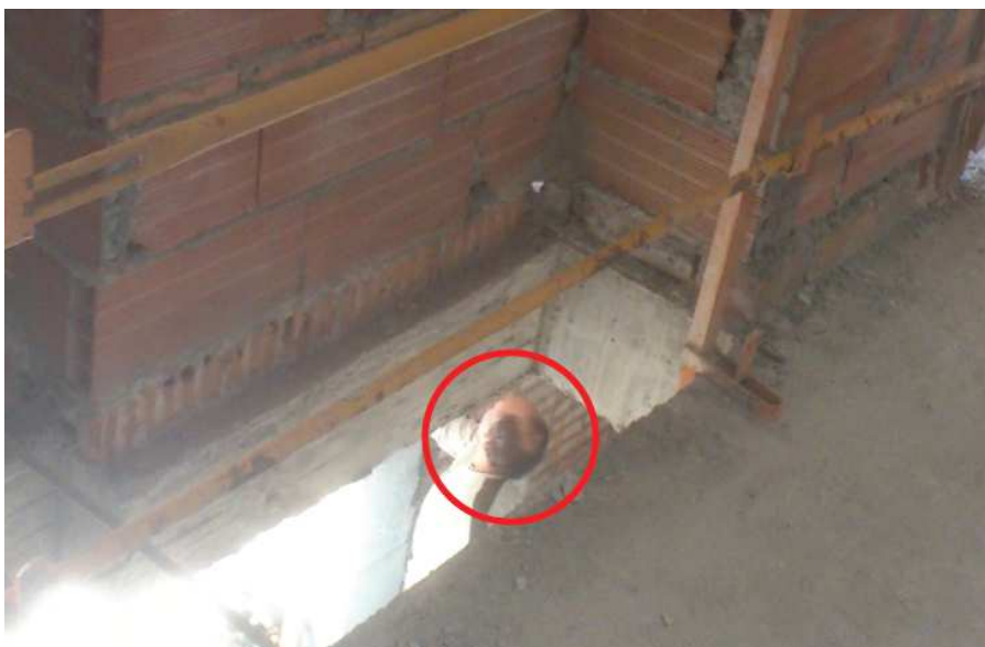
Ilustración 5: trabajador que le falta el casco.