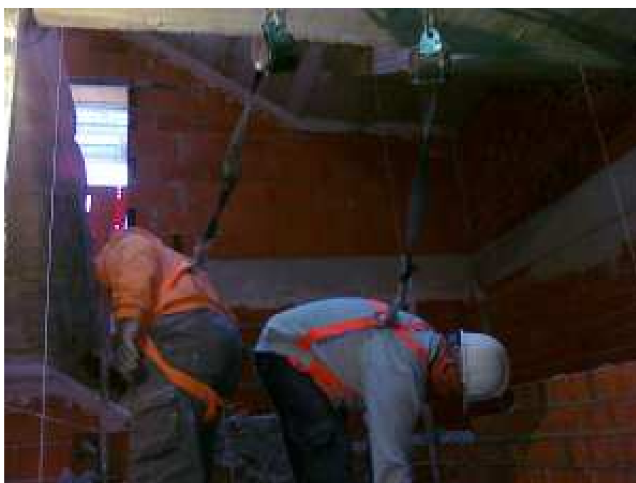
Ilustración 4: Trabajadores correctamente atados.