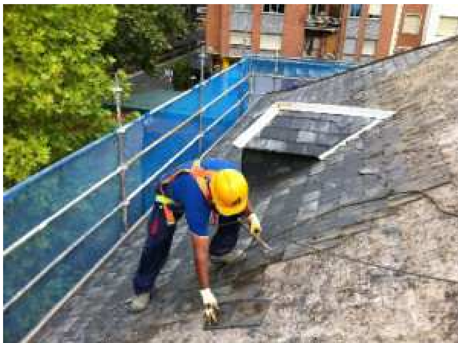
Ilustración 3: Correcta utilización de EPI's y de valla de seguridad.