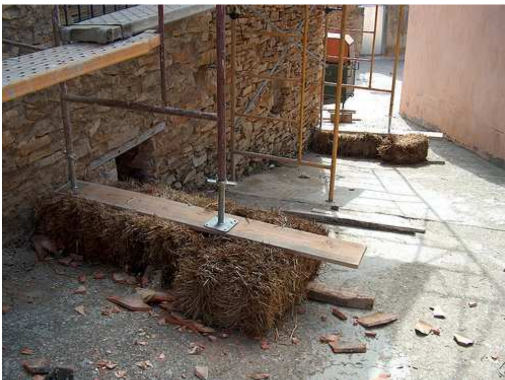
Ilustración 6: andamio con apoyo incorrecto.