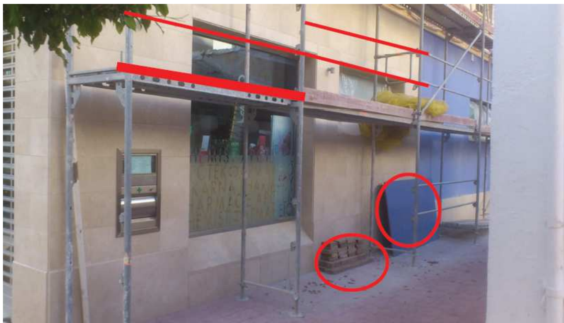
Ilustración 7: andamio sin rodapié ni barandillas.