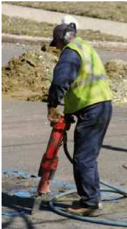
Ilustración 2: Correcta utilización de EPI's.