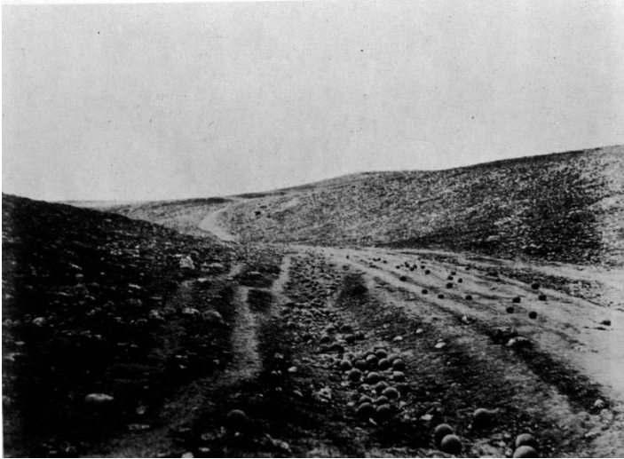
Fotografía de Roger Fenton, Valle de la sombra de la muerte, 1855.

En aquellos momentos las fotografías estaban condicionadas por algo más que las naturales limitaciones tecnológicas. El hecho de que el primer reportaje de guerra hubiera sido previamente censurado es algo bastante conocido, pues la expedición de Fenton fue financiada por la empresa “Agnew” a condición de que no fotografiara nunca los horrores de la guerra, para no asustar a las familias de los soldados.