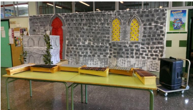
Escenario creado por los alumnos.