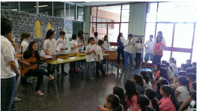
Actuación de nuestros alumnos "Cançó de la Rosa de Paper"