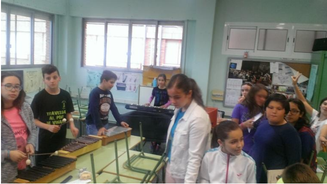
Ensayo con los instrumentos.