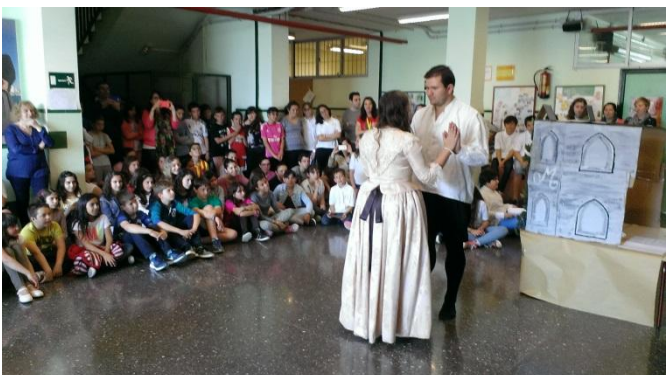
Obra de teatro "Romeo y Julieta"