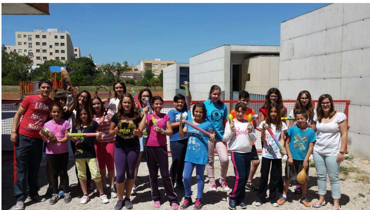
Concierto realizado en el patio del colegio.