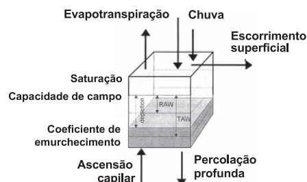
Figura 2: Esquema do balanço na zona radicular (Allen et al. , 1998, Fig. 43)

para descanso, descontração, combate ao stress. O seu benefício não se mede por grandezas físicas ou financeiras, mas pela saúde mental e, conseqüentemente, pela qualidade de vida que proporciona e ajuda a manter.