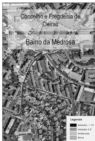
Figura 1: Bairro da Medrosa - Oeiras

cuja avaliação e fruição é primeiramente visual, visa recriar espaços de Natureza,