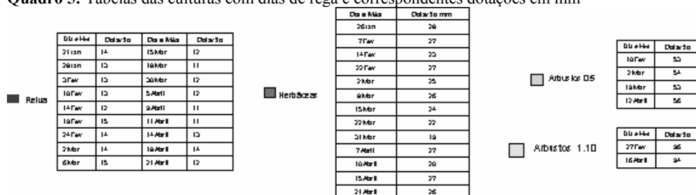
Quadro 5: Tabelas das culturas com dias de rega e correspondentes dotações em mm

Deste modo, o Modelo recolhe a evolução meteorológica diariamente; determina os parâmetros de rega em tempo real, e faz executar a oportunidade de rega, dotação, duração de rega. Para a aspersão, e caso o sistema de rega permita executar, o Modelo determina a intensidade média de precipitação e grau de pulverização adequados.