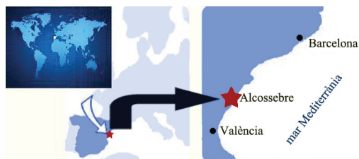
FIGURA 1. Localització de la població de Xerosecta explanata trobada a un àrea dunar costanera al terme d'Alcossebre.

Finalment a l'octubre de 2011 es va localitzar una zona amb exemplars vius d'aquesta espècie a Alcossebre, a 1,5 Km al sud d'on es va trobar la primera closca. La població es localitza dins d'una àrea d'uns 13.000 m 2 limitada per un camí asfaltat, construccions residencials i parcel·les de cultius abandonats. Les construccions divideixen l'àrea ocupada en dues zones, sent més escassa la presència de X. explanata a la zona més meridional on existeixen abocaments de residus inerts i restes de jardineria, que potser han causat la introducció d'una flora invasora. A l'altra zona, la més septentrional, l'espècie és molt més abundant: s'arriben a comptabilitzar 16 exemplars vius per m 2 als punts de major densitat.