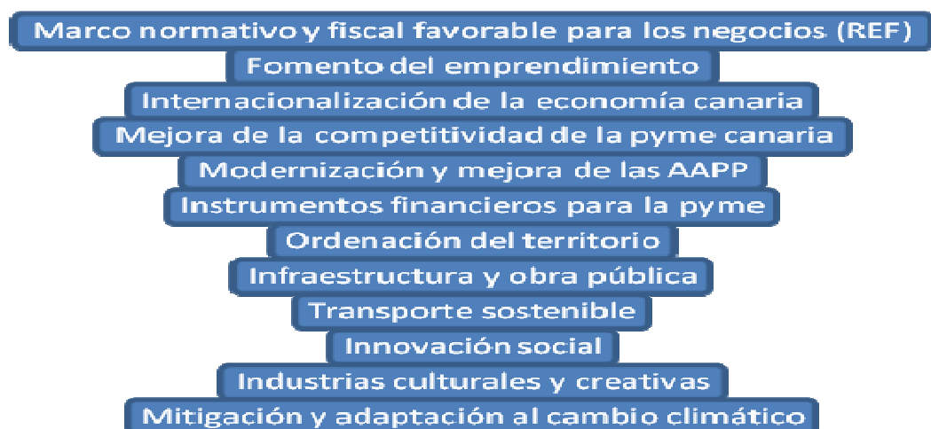
Ilustración 2: Acciones transversales para el desarrollo de la Estrategia Europa 2020 en Canarias

Dichas prioridades se complementan con las siguientes acciones de carácter transversal, que se detallan en el apartado 4.2.