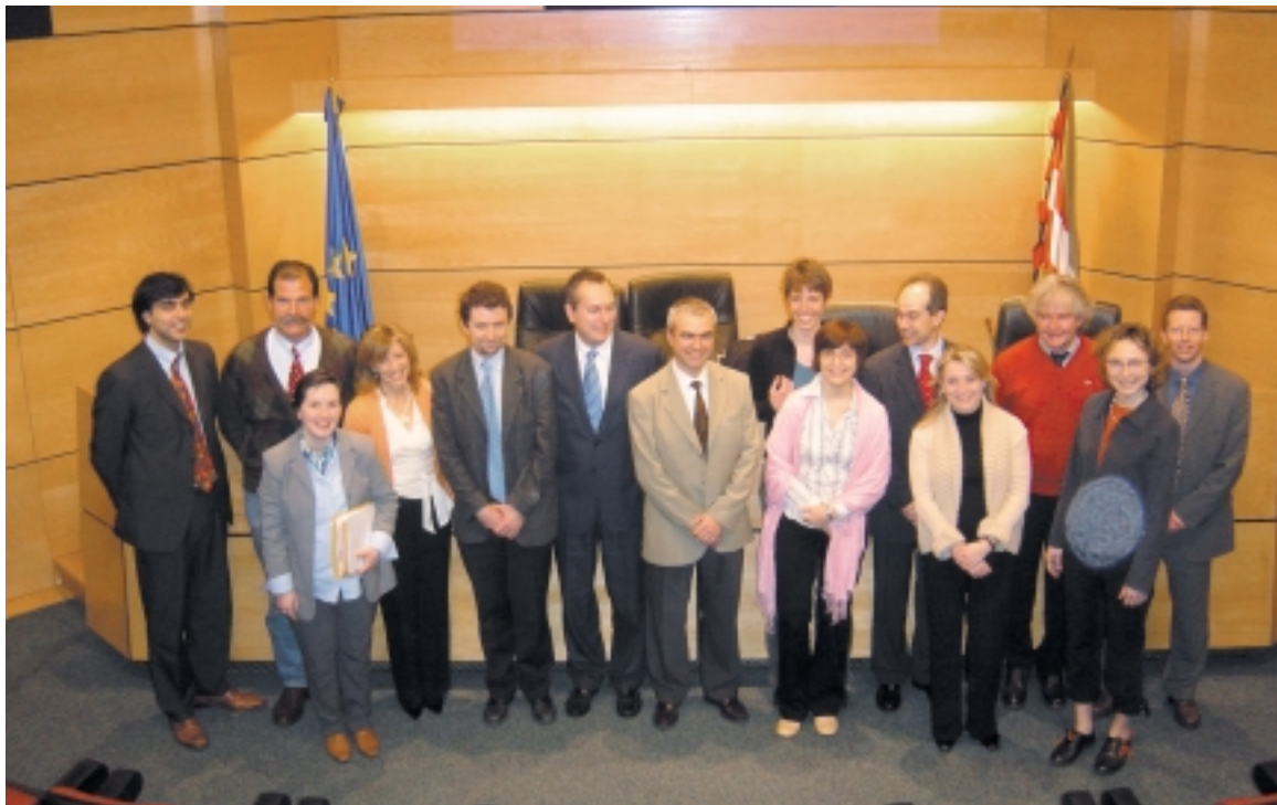
Representantes de las regiones participantes.

El pasado 5 de Abril se celebró en Bilbao la reunión del Grupo de Transportes del Arco Atlántico, que en la actualidad está pilotado por el Gobierno Vasco.