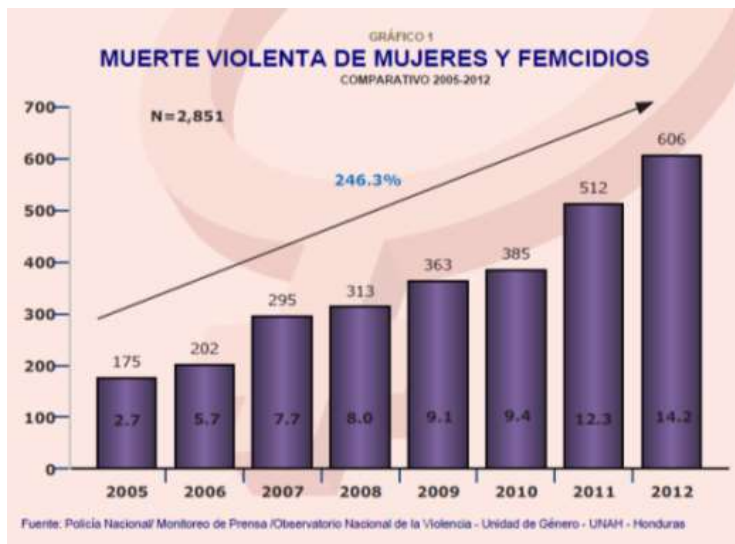
Figura 1: Observatorio nacional de la Violencia del Instituto Universitario en Democracia, Paz y Seguridad (IUDPAS)

de explotación sexual según la Oficina de Naciones Unidas contra la Droga y el Delito (UNODC, 2012, p.4).