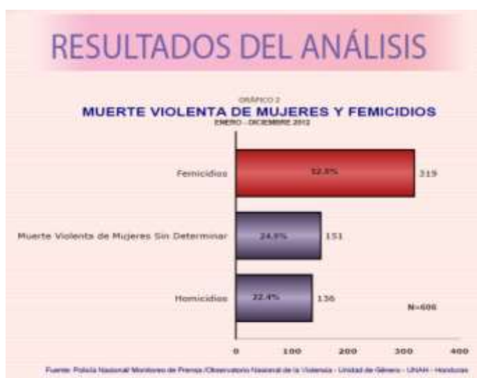
Figura 2: Observatorio nacional de la Violencia del Instituto Universitario en Democracia, Paz y Seguridad

Según datos del Observatorio Nacional de la Violencia del Instituto Universitario en Democracia, Paz y Seguridad (IUDPAS) desde el 2005 hasta el 2013, la muerte violenta de mujeres ha aumentado en un 263.4%". En 2013 se registraron 636 asesinatos de mujeres, lo que implica un asesinato cada 13.8 horas. Este incremento se ve