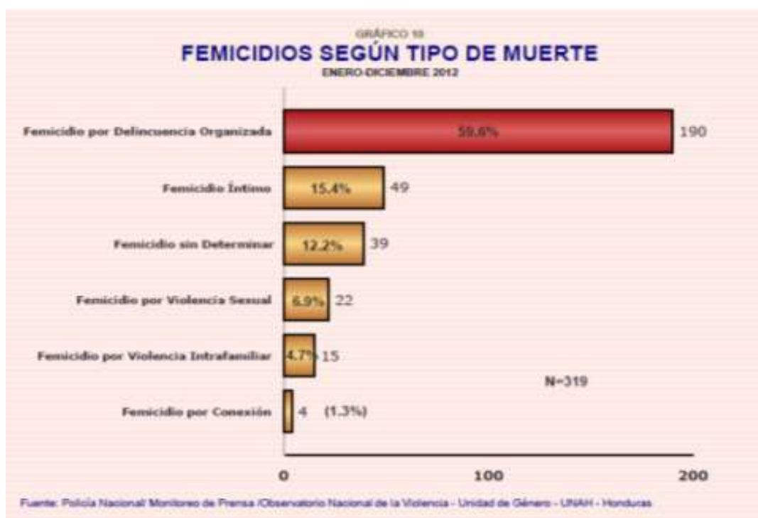
Figura 3: Observatorio nacional de la Violencia del Instituto Universitario en Democracia, Paz y Seguridad (IUDPAS)

Como podemos apreciar en la figura 3, la gran mayoría de femicidios se producen en el marco de la delincuencia organizada según datos del Instituto Universitario en Democracia Paz y Seguridad (IUDPAS). Del total de femicidios, podemos apreciar que el 59% de ellos corresponde al CO y el 15% al femicidio íntimo. Es notable que el 12,3% de los femicidios se califiquen “sin determinar”, es decir, se desconozca quién fue el victimario o no sea posible categorizarlo porque las condiciones contextuales son insuficientes.