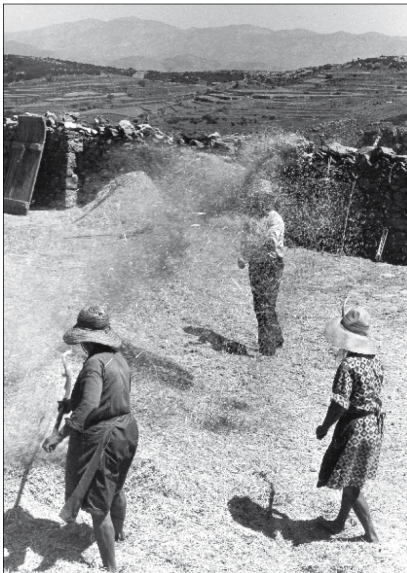
Ventant la batuda.

de cànter, es pot fer servir amb la mateixa funció una albarca, una sabata vella, un pot, etc.