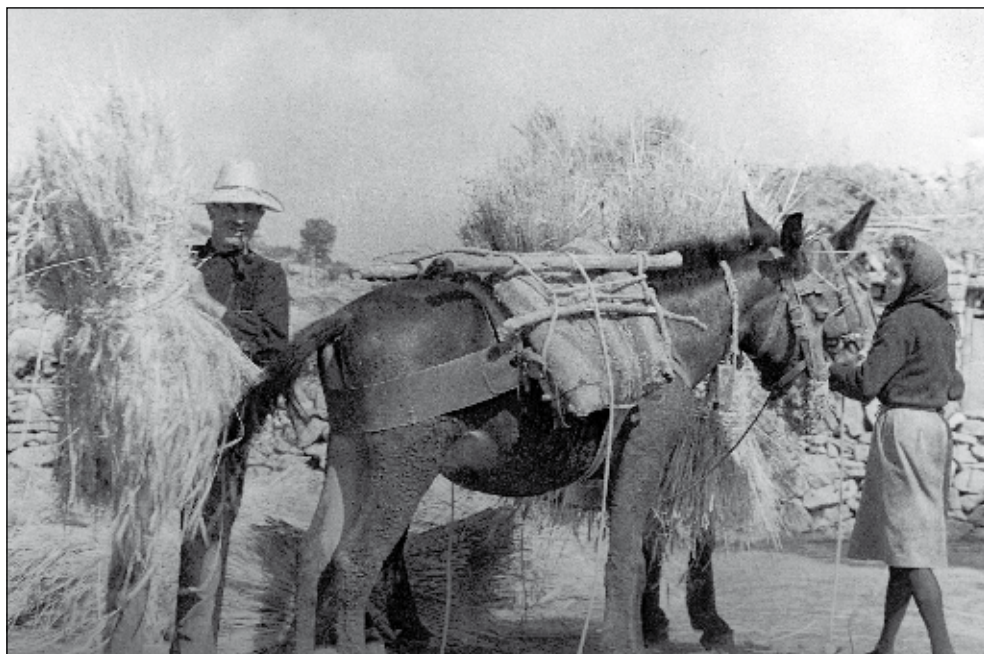
Descarregant garbes.

Pel que fa al gra que queda damunt l'era, es torna a llançar cap amunt; però, en aquesta ocasió, amb una pala de fusta 9 i així s'acumula, a mode de piló, alhora que una dona li trau les palles grosses i les espigues que resten encara.