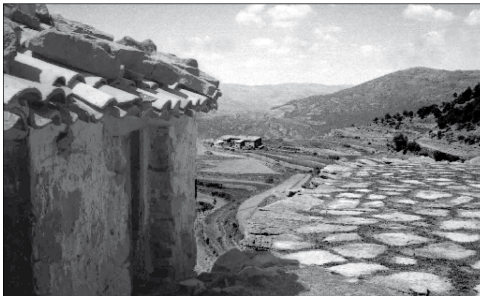
Era enllorada.

persones pressionen amb les mans sobre la barra per a espentejar la palla de manera que quede apilada en un lloc on haja de rebre el vent de llevant. Aquests munts de palla apilada s'anomenen serra i, una vegada feta la primera muntada amb els matxos i la barra, completen la feina tres persones arrossegant un rastr , 6 que és, podríem dir, una mena de pinta de fusta prou gran amb un pal incrustat perpendicularment, també de fusta, que fa de mànec i del qual s'agafen per a estirar i anar arrossegant i amuntonant la palla. Una vegada s'ha apilat el gros de la palla, es remata la feina agranant l'era amb uns raspalls fets d'herba marginera, que és una planta silvestre semblant al gira-sol.