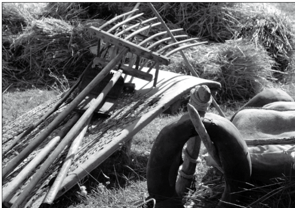
Ferramentes per trillar

Com hem dit, en ocasions, el trill pot ser arrossegat per un sol matxo, però si s'enganxen dos animals s'anomena conlloga de dos , 5 si van estirant tres matxos amb colla de tres i si en són quatre amb colla de quatre . Tanmateix, una colla de tres o més animals, de vegades, pot arrossegar alhora dos trills. I encara, per últim, en alguns masos que tenien molts dies de trilla, per ser més eficients i avançar més en la feina solien trillar dues colles de matxos alhora però independentment l'una de l'altra.