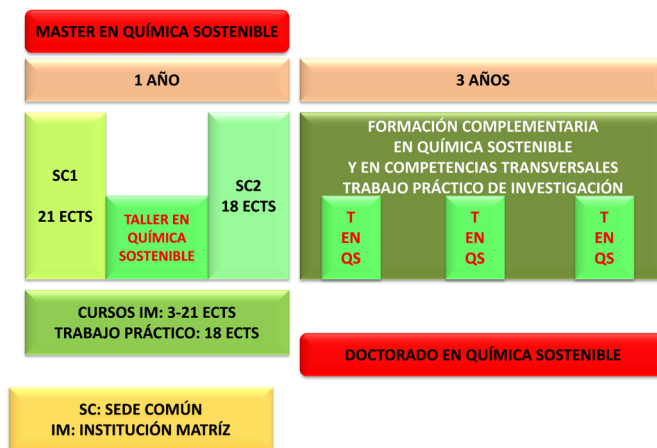
Figura 4. Organización académica del Máster y del Doctorado Interuniversitario en Química Sostenible.

Siempre que las circunstancias económicas lo permitan, la Comisión Académica gestiona el que entre los dos periodos de docencia común se realice un Taller de Química Sostenible con la participación de expertos de distintos países que imparten un número reducido de sesiones (no más de tres) durante dos días consecutivos y están disponibles para realizar consultas y un trabajo más práctico con los estudiantes durante los días próximos al evento. Este taller varía cada año, lo que permite que pueda ser seguido, como una herramienta formativa fundamental por los estudiantes de doctorado durante los tres años siguientes al Máster.