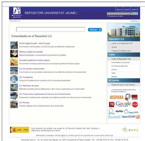
Pantalla de inicio del Repositori UJI

un “producto” de la universidad pero su misión va más allá de ser exclusivamente el archivo de la producción científica propia. Desde sus inicios se proyecta como un servicio orientado a los usuarios, para satisfacer sus necesidades y demandas de acceso a la información, en concreto, a recursos digitales. Así, la preservación y difusión, finalidades de todos los repositorios, se aplican a contenidos de procedencia tan diversa como son el patrimonio documental de la provincia de Castellón, la producción científica, docente e institucional de la universidad, y a otros recursos externos, de interés para la comunidad universitaria.