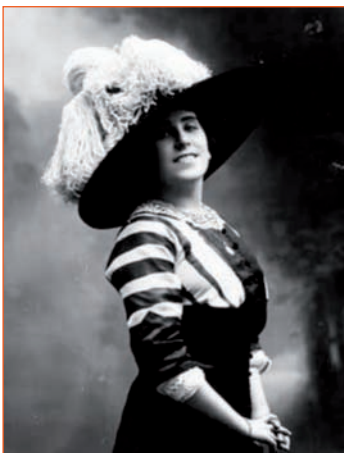
LUCREZIA BORI (Lucrecia Borja González de Riancho)- Soprano valenciana y 1ª mujer miembro de la directiva del Metropolitan Opera House de New York