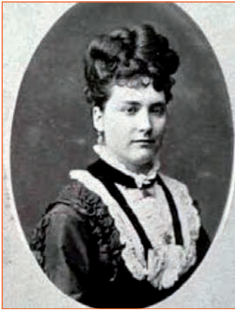
MATILDE PÉREZ MOLLÀ- 1ª Alcaldesa en España (Quatretondeta-Alicante)