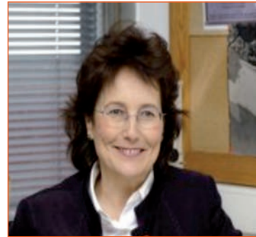
CARMEN ASCASO CIRIA- Subdirectora del Instituto de Recursos naturales del Consejo Superior de Investigaciones Científicas –CSIC- (actualmente dirige el servicio de Microscopia y el grupo de investigación de Ecología Microbiana)