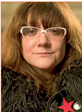
ISABEL COIXET CASTILLO - Licenciada en Publicidad por la Universidad de Barcelona. Directora de cine. Ganadora del premio Goya a la mejor dirección (2005)