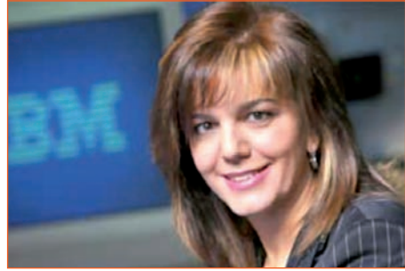
AMPARO MORALEDA MARTÍNEZ – Presidenta de IBM en España y Portugal