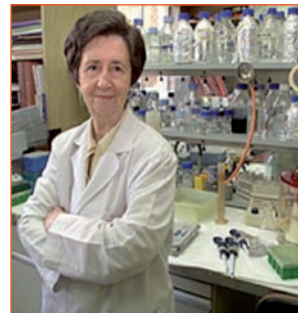
MARGARITA SALAS FALGUERAS- Miembra de la Real Academia de Ciencias Exactas, Físicas y Naturales, de la Real Academia Española de la Lengua, de la Academia Europea de Ciencias y Artes, de la American Academy of Microbiology, de la American Academy of Arts and Sciences y presidenta de la Fundación Severo Ochoa. Primera mujer española miembro de la Academia Nacional de Ciencias de Estados Unidos.