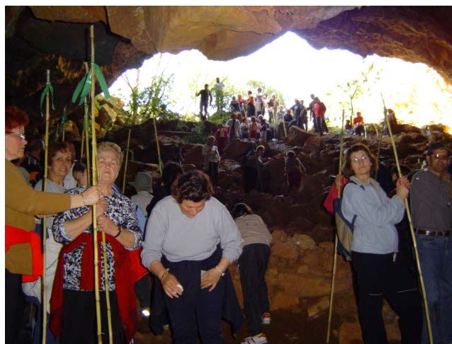
Figura 4. Cueva de San Vicente

La hipótesis de asentamiento de forma esporádica o permanente durante la Edad del Bronce en el castillo de Castro, en base a los petrogrifos paralelos existentes en el interior del recinto, no puede descartarse teniendo en cuenta la posición estratégica del enclave.