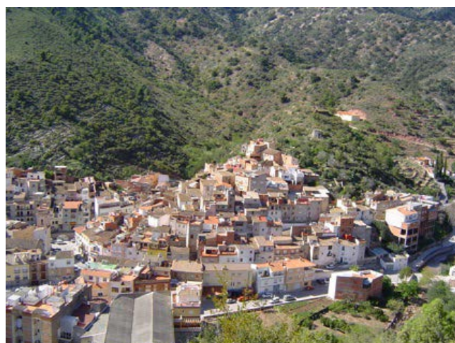
Figura 1. Vista del pueblo de Alfonso de Guilla