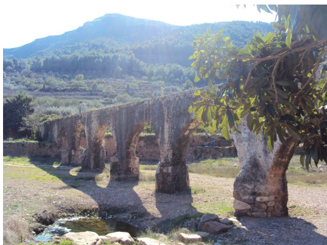
Figura 5. Acueducto. Pont de l'aigua

La existencia de numerosos asentamientos y villas en Uxó y pueblos circundantes (El Pinar y Corrallets en Artana; barrio de l'Alcudia, camí de Cabres, camí de Clotxes, Font del Canyet, Pla d'Odell, Horta Seca, en La Vall d'Uixó; l'Alquería y Rajadell, en Moncofa; la Font Calda, Santa Bárbara, el Secante, en Vila-Vella, etc.), nos lleva a considerar la posibilidad no de villae en el sentido de «centro agrario de cierta envergadura que tenía por finalidad la producción de excedentes» (Jàrrega, 2011), pero sí explotaciones menores dependientes de las villae de La Vall d'Uixó.