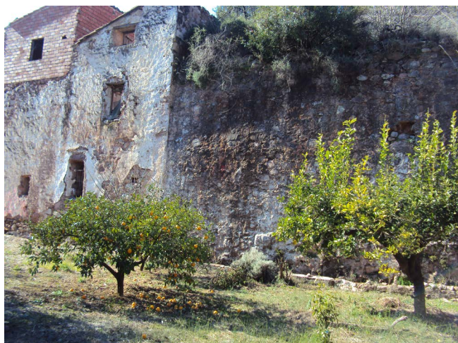
Figura 8. Molino

bastante pequeño. En opinión de Honorio García (1962):