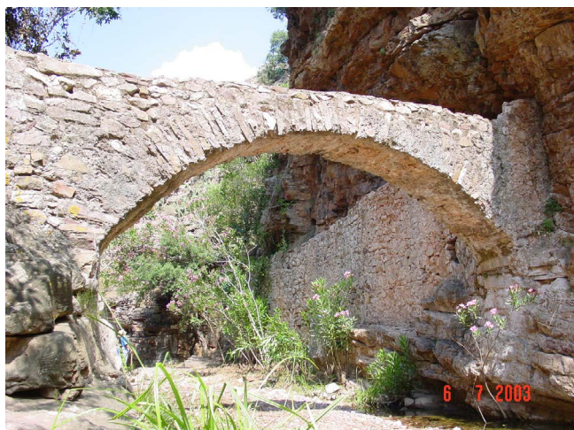
Figura 5. Arco romano. Arquet