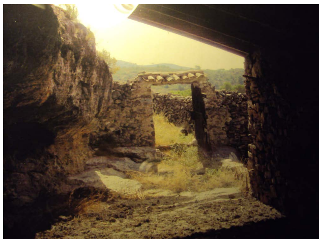
Figura 9. Paridera