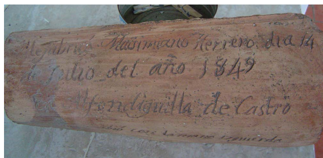
Figura 3. Teja de la alquería de 1849

Por último, cuando se procedió a la reparación de una pequeña alquería, sita en las inmediaciones del pueblo, una de las tejas de la techumbre,