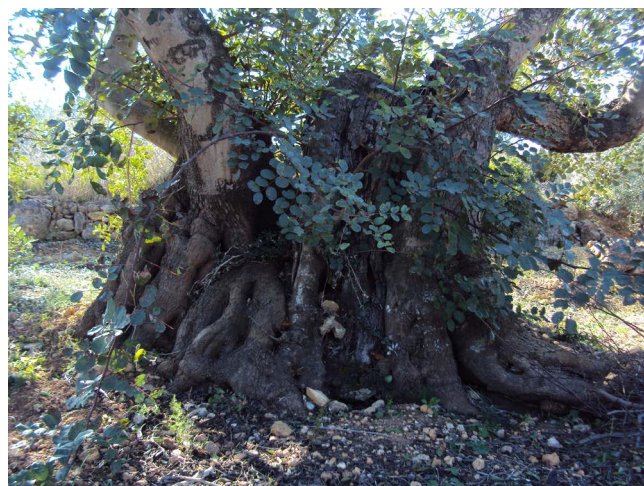
Figura 6. Algarrobo centenario