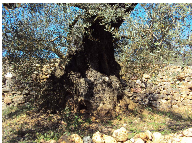
Figura 9. Olivo milenario

De la vida y costumbres de los habitantes de nuestro pueblo, durante los cuatrocientos años que median desde la conquista de Abdel-Aziz hasta la llegada de Jaime I, poco sabemos. Desde el punto de vista económico, no pasaría de ser una vida de subsistencia: el inicio del abancalamiento de los montes, la domesticación del agua y los olivos y algarrobos que aún perduran y que fueron plantados en aquellas épocas (figura 7). Cereales, higos, vino,