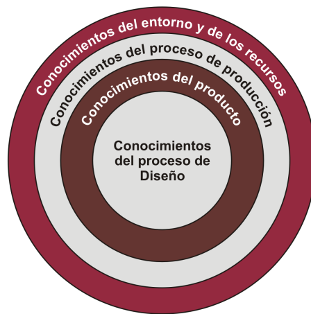
Figura 2. Clasificación propuesta de las categorías de conocimiento en diseño.

Se pretende que la clasificación propuesta en este documento amplíe notablemente el rango de conocimientos y criterios para ser aplicados luego en el desarrollo de métodos o herramientas que contribuyan a la gestión del conocimiento en el proceso de diseño.