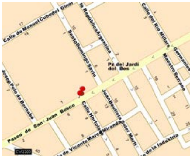
Imatge 1. Plànol de la situació del col·legi San Juan Bosco

En l'actualitat, el centre es troba integrat dins del casc urbà de la ciutat, en una zona privilegiada. Està molt bé comunicat, ja que es troba junt al Camí d'Onda, artèria que uneix Borriana amb l'estació de ferrocarril, amb la carretera nacional 340 i l'autopista A-7.