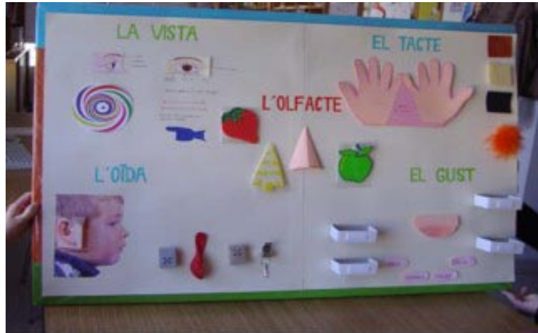
Imatge 4. Mural "Els Cinc Sentits"