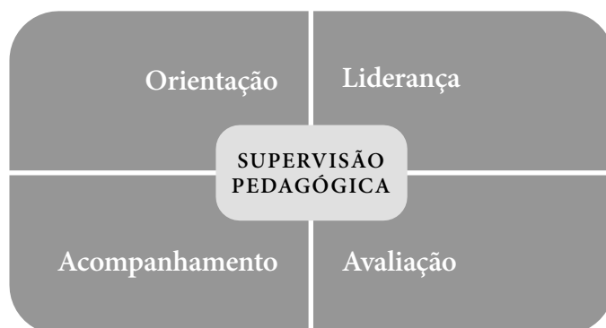
Figura n.º 2. Eixos da supervisão pedagógica

Estes eixos desenvolvem-se num conjunto de ações que sustentam as práticas da supervisão e se explicitam, na Figura n.º 3, por conceber e problematizar, observar e refletir, decidir e comunicar, e intervir e avaliar.