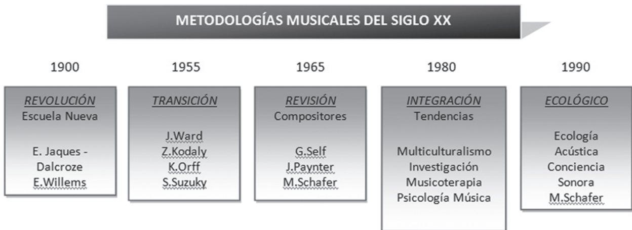
Figura n.2: Evolución de la Pedagogía Musical en el S. XX.

Antes de nada convendría conocer algunas de las metodologías musicales que han tratado el ritmo y la improvisación como eje vertebrador de su filosofía. Por ello se recurre a VIOLETA HEMSY DE GAINZA (2003), quien ha realizado una de las clasificaciones más utilizadas en torno a las principales metodologías de educación musical del siglo XX (ver Figura 2). Si se ahonda en el contenido de cada uno de los periodos y autores descritos en la Figura 2, se aprecia el valor que se le ha dado a la improvisación dentro de dichas metodologías. Quizás uno de los momentos más fructíferos para la improvisación rítmica dentro de la historia de los métodos de la educación musical, haya sido la etapa revisión , con autores como Schafer, Self o Paynter. No obstante, todas las etapas exaltaron de un modo u otro la improvisación musical como herramienta de gran valor educativo.