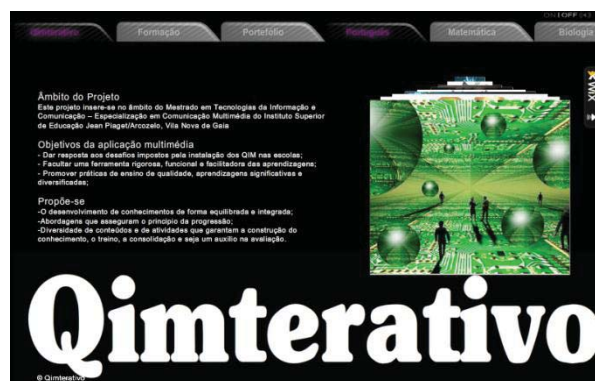
Ilustração 8 - Panorama geral do sítio de apoio à

Optámos por colocar nesta plataforma o endereço do nosso sítio, cuja consulta poderia fornecer informação adicional e recursos de diferentes grupos disciplinares (construídos pelas formadoras) aos formandos.