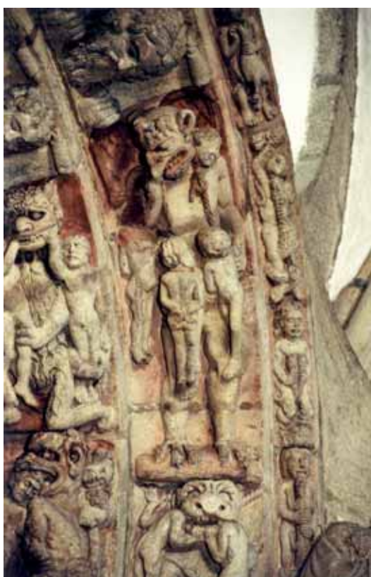
Fig. 4. Pórtico Gloria. Arco derecho. Detalle izquierda.

D. Alexandre-Bidon y D. Lett, son especialistas de la infancia en el medioevo y, en este caso, han tomado como referencia la normativa de los penitenciales de Beda, etc. En ellos la línea de fuerza subyacente es la misma y, conforme a estos autores, en los penitenciales de «siglos sucesivos las penas se agudizan hasta doce años de ayuno». 26 Por supuesto que valora de manera diferente la interrupción voluntaria del embarazo, de modo que la severidad de la pena es superior ante el aborto de una niña.