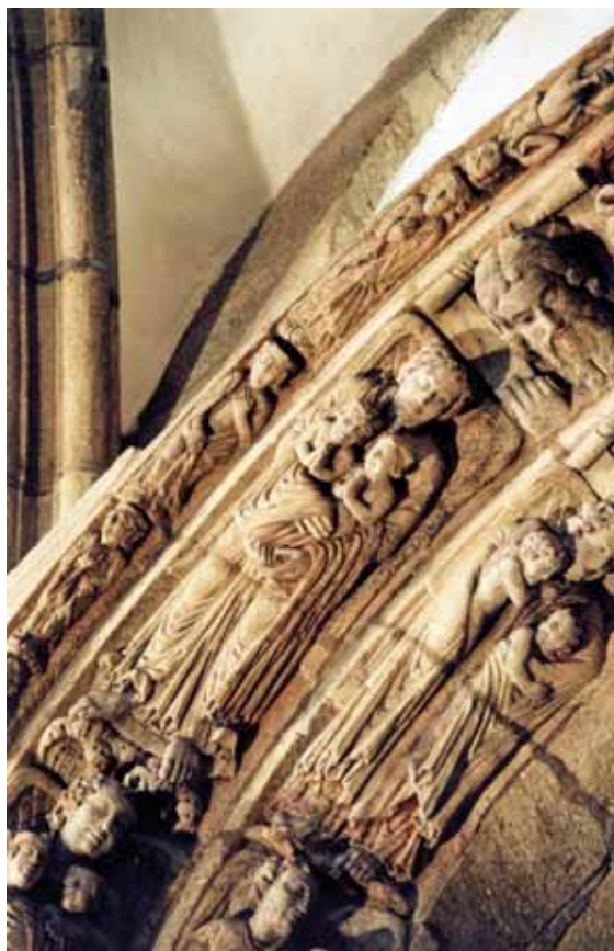
Fig. 3. Pórtico Gloria. Arco derecha. Detalle izquierda.

En esta perspectiva, se imponen tres cuestiones previas. Era un momento ligado a la formación de clérigos compostelanos en el extranjero cuando, según la divulgación de los libri poenitentiales alcanzaban una amplia difusión para posibilitar la confesión y así encarar los cuidados del alma. Faltas morales que preocuparon a la Iglesia desde los primeros momentos. Lo particularmente llamativo es que el planteo de Juan Cassiano de alguna manera prosigue en lo que son los principales pecados mortales en los penitenciales posteriores del Réginon de Prüm, Burchard de Worms, el Pontifical romano-germánico, tan vigentes durante toda la Edad Media, 19 al contener los baremos indicativos para los peregrinos penitentes, de manera que, luego de la confesión auricular, procede la sanción que «concibe la penitencia como medicamento para el alma» (B. de Worms).