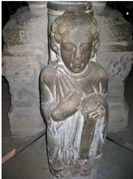
Fig. 2. Meus peregrinus 2.

espíritu y el espíritu a Dios, 18 de manera que la persona carnal es la sustancia racional indivisible, afirmaba Boecio, que no está regida por las mismas leyes que el ser espiritual. Es un testimonio de su participación en la gloria. Conforme a esta distinción, cuando J. Wirt analiza el nacimiento de la imagen medial, considera que en Boecio aflora una concepción espiritualizada de la imagen que es partícipe de la forma, de la apariencia, pero no del concepto materia consustancial con el cuerpo. Concepto aplicable a los profetas y apóstoles, aunque la experiencia exterior de los apóstoles sea más liberadora, menos sometida al efecto plano. Pero este conjunto de taller o maestros diferentes plantean una vinculación esencial: los fundamentos de la Ecclesia Universalis que confieren valor al agustiniano principio atento a desarrollar que «somos edificados en Cristo, sobre la base de los Apóstoles y de los Profetas» (E. Ps. LXXXVI, PLXXXVII). La distinción de los tres reputados «pilares apostólicos» (Pedro, Santiago, Juan), se complementa con Pedro, a quien Rabanus Maurus consideraba apostolus architectus , en tanto que puso el fundamento estable para la edificación de la Iglesia de Cristo y fue modelo de predicación entre el clero.