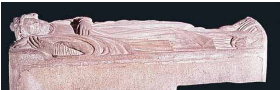
Fig. 5. Yacente de Alfonso IX. Capilla de las Reliquias de la catedral de Santiago.

Los vectores edificantes de este rey «bien cimentado en la fe católica» (Tudense), junto con la política repobladora, organización parroquial, presencia de núcleos monásticos importantes... justifican todo un crecimiento templario, lo que introduce inevitablemente «en la ampliación de la fe católica durante su reinado» (Tudense). De este modo, conforme a los aspectos resaltados por H. Martin sobre las atribuciones y funciones del rey, éste se convierte en «guía para la salvación de su pueblo». En tal sentido hay que señalar aquí la asistencia humanitaria al necesitado donde, 53 conforme a la época, procede a elaborar un estatuto en favor de los peregrinos de Santiago y, en 1228, habrá de ser en el Concilio Nacional de Salamanca donde quede establecida una constitución. 54 Dicho esto, no es menos evidente que su actitud sienta las bases a lo establecido por su nieto Alfonso X en Partidas I, 23.