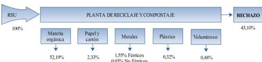
Figura 1. Planta de reciclaje y compostaje de Onda

La humedad del CDR analizado es del 17,94%. Este porcentaje supera los estándares establecidos por las cementeras españolas y suecas, los cuales indican que la humedad ha de ser menor al 10%. En cambio, en el caso de los estándares generales de Alemania, la humedad puede alcanzar el 25%.