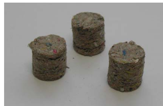
Figura 3. CSR producido en la PRC de Onda

partícula, contenido en cenizas, humedad, poder calorífico inferior (PCI) y composición química. Además, también se ha determinado la concentración de metales pesados y halógenos que vienen regulados por la Directiva 2000/76/CE sobre incineración de residuos. En la tabla 3 se muestran los parámetros analizados y los resultados obtenidos. Todos los resultados del análisis han sido tratados estadísticamente para presentar unos datos medios que caractericen adecuadamente al CDR.