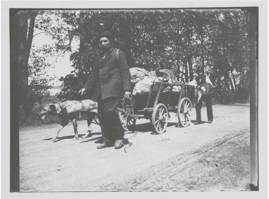
Abb. 4: Fotografie Heinrich Zilles, Mann, Hund und Junge mit einem Karren, Berlin 1900. Häufig dokumentiert ist das Hundefuhrwerk als Transportmittel von Deklassierten wie z.B. Lumpensammlern, die bis in die 1950er Jahre diese Form der Lastenbeförderung nutzten. © Stiftung Stadtmuseum Berlin.

den ärmeren Kreisen nicht jeder die Haltung eines eigenen Hundes leisten konnte, wurden Zieh Hunde in Berlin sogar vermietet. Wir wissen um diese Praktik, weil den bürgerlichen Zeitgenossen dabei wohl oft ein tierquälender Umgang der Mieter mit den Hunden auffiel. So berichtet ein Artikel in der Monatsschrift des Berliner Tierschutzvereins Anwalt der Tiere 1908: