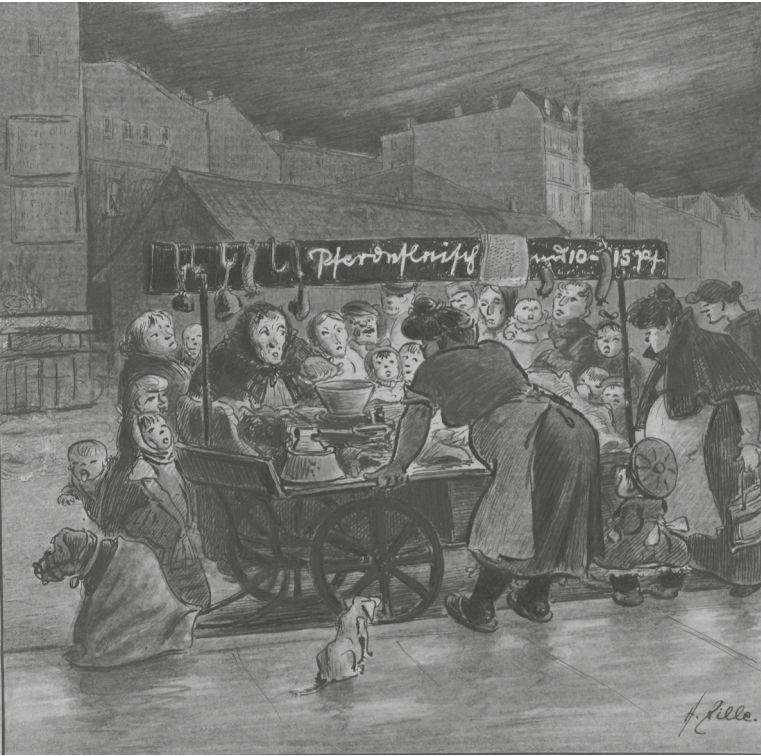
Abb. 3: Aquarell Heinrich Zilles, Am Pferdefleischwagen, Berlin 1910. Tierschützer monierten häufig die Verwendung ungeeigneter Geschirre, Fahrzeuge und Lasten; zugunsten des Tierwohls bemühten sie sich, um ein Verbot der Hundefuhrwerke.

Bezeichnung nach seiner Nutzergruppe. 33 Der im Vergleich zum Wagen kläglich wirkende Ziehhund erscheint vom Transport in die Stadt erschöpft. Tierschützer monierten häufig die Verwendung ungeeigneter Geschirre, Fahrzeuge und Lasten. Denn oft standen Gewicht und Größe des Wagens nicht in einem angemessenen Verhältnis zur Schwere und Größe des Hundes. Das Geschirr verbesserte nicht nur die Zugkraft des Hundes, sondern war durch die Anschirrung an der Wagendeichsel ein materielles Verbindungsstück zwischen Hund und Fuhrwerk. So gewährleistete die Anspannung am Wagen mithilfe eines Geschirrs die sichere Verwahrung des Hundes am Fuhrwerk. Darüber hinaus konnte die Fuhrperson über die Wagendeichsel die Geschwindigkeit und Bewegungsrichtung von Hund und Wagen vorgeben. Dennoch blieb der Transport vom Mitwirken des Hundes abhängig, der auch in Störfällen eingreifen und auf Umweltreize reagieren konnte. So wie sich