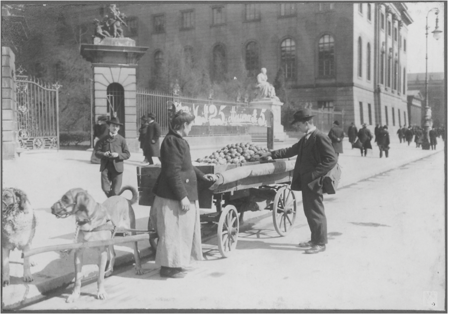
Abb. 2: Fotografie Max Missmanns, Fliegende Kartoffelhändlerin. Unter den Linden vor der Universität Berlin, Berlin 1906. Hundefuhrwerke waren insbesondere im urbanen Straßenhandel eine wichtige alternative Transporttechnik.

Diese Wagenkonstruktion besaß zwei große Räder, Blattfedern und eine Hängevorrichtung für Milcheimer. Der Hamburger Milchkarren ermöglichte einen erschütterungsarmen Transport der Milch. Der Zieh hund lief unterhalb der Achse und konnte sich bei Stillstand des Fuhrwerks unter dem Wagen bewegen. 28 Oft nutzten die Fuhrwerkshalter jedoch selbstgemachte Provisorien als Wagenkonstruktionen – wie in der Fotografie von Max Missmann (1874–1945) aus dem Jahr 1906 zu sehen ist, die den Einsatz von Zieh hunden im Gemüsekleinhandel Berlins dokumentiert (siehe Abb. 2). Es ist eine Fliegende Kartoffelhändlerin abgebildet, die vor dem Berliner Palais Unter den Linden Kartoffeln zum Verkauf anbietet. Vor einen vierrädrigen Wagen sind zwei große Hunde gespannt. Hundefuhrwerke fuhren und hielten in der Regel am äußeren Fahrbahnrand – wie es auch in dieser Fotografie erkennbar ist. Einer der beiden Hunde ist aus dem Fuhrwerk ausgespannt und steht auf dem Bürgersteig. Da Pferd und Hund ähnliche anatomische Voraussetzungen an ein Geschirr erfüllten, wurden auch für Zieh hunde die beiden Grundformen des Pferdegeschirres gewählt – das Sielengeschirr und das Kunt. 29 Die Anspannung von zwei Hunden erfolgte rechts und links an der Deichselstange sowie mit Ortscheiten. Die Aufnahme erfasst die Zieh hunde nur teilweise.