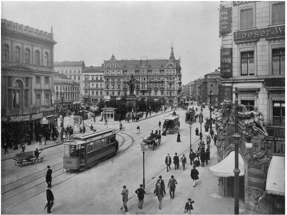
Abb. 1: Der Berliner Alexanderplatz, Berlin 1903. Die Fotografie verbildlicht die Transportmittel und Verkehrsteilnehmer um 1900. So koexistierten elektrische Straßenbahnen, Pferdekutschen und Hundefuhrwerke im Berliner Straßenverkehr.

Mannes“ zeugen. 3 So erscheint auch in Abbildung 1 am Bildrand links ein Hundefuhrwerk, das von einer Fuhrperson und dessen Hund gezogen wird. Es fällt auf, dass in der dargestellten Szenerie die tierischen Transportmittel in der Anzahl den Straßenverkehr am Alexanderplatz dominieren. Zudem belegt diese Stadtfotografie, dass um 1900 viele Transportmittel – wie u.a. elektrische Straßenbahnen, Fahrräder, Pferdekutschen und Hundefuhrwerke – im Berliner Straßenverkehr koexistierten.