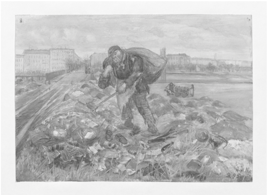
Abb. 5: Bleistiftzeichnung Heinrich Zilles, Müllsammler, Berlin 1895. Durch ihre Beziehung zur ärmeren Bevölkerungsschicht waren Ziehunde in den Zwischenzonen von Stadt und Land präsent. In den Mülldeponien fanden Mensch und Hund verwertbare Abfälle.

Als Transportmittel der Ärmsten prägten Hundefuhrwerke häufig das Bild der städtischen Randbezirke; umgeben von Dreck, Krankheiten, Chaos, Lärm und Abgasen. Eine Aquarellzeichnung von Zille – datiert auf das Jahr 1895 – zeigt einen Müllsammler (siehe Abb. 5). Mit Müllsack und -greifer scheint der in Lumpen gekleidete Mann nach verwertbaren Resten in den Müllbergen am Stadtrand zu suchen. Die Spree trennt an dieser Stelle das Stadtzentrum von der Mülldeponie an der Berliner Peripherie. Im Hintergrund der dargestellten Szenerie ist zwischen Müllberg und Stadt-Skyline ein stillstehendes, vollbeladenes Hundefuhrwerk zu erkennen. Zwei Frauen – der gekrümmten Körperhaltung nach zu deuten älteren Alters – sind dem Fuhrwerk zugehörig.