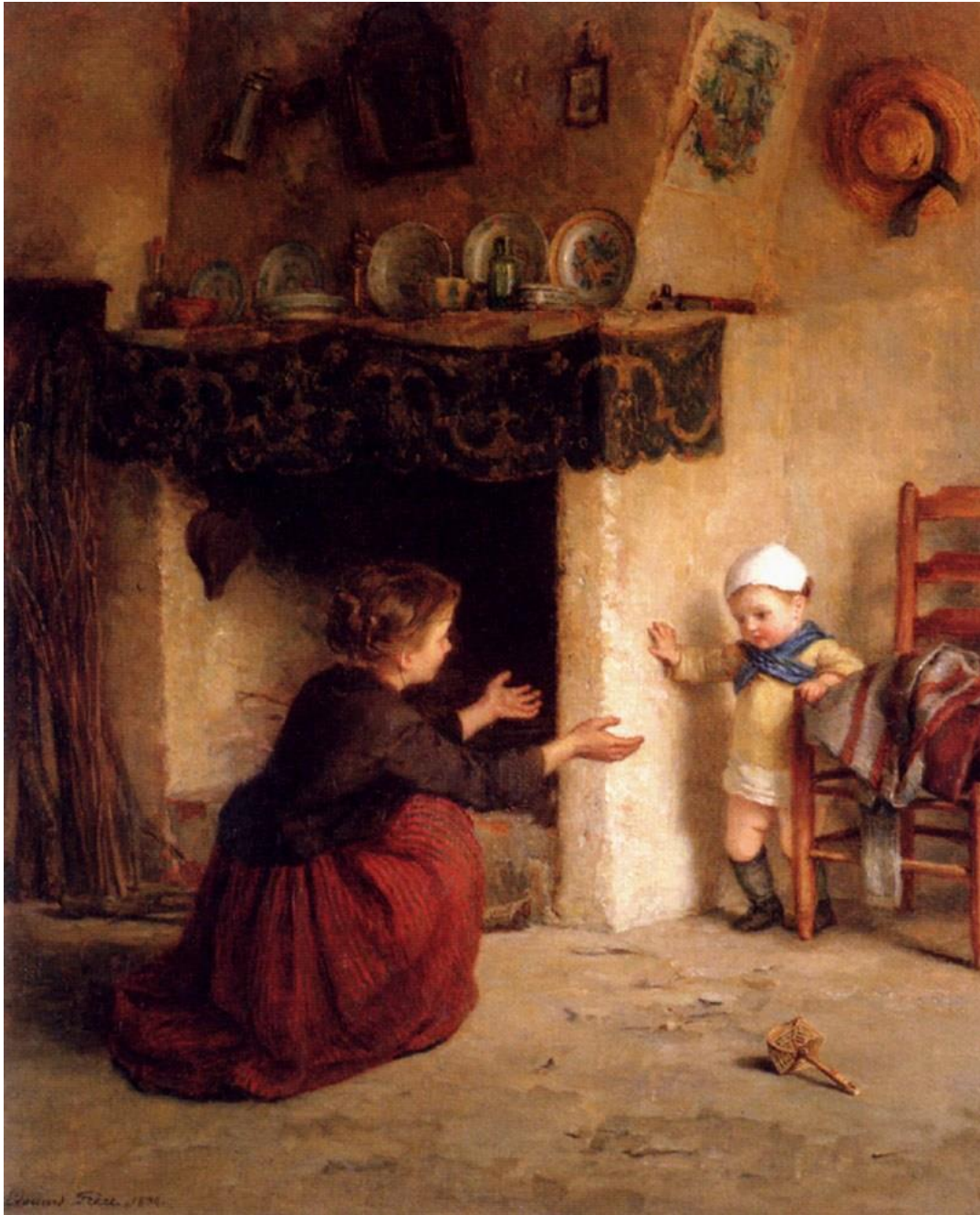
Le Premier Pas ta' Edouard Frere (1876),