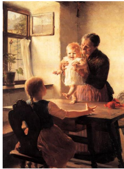
Erste Schritte ta' Georgios Jakobides (1889, 1893),