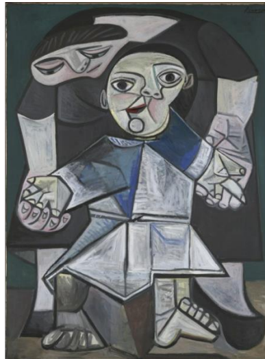
Omm u Wild (L-Ewwel Passi) ta' Picasso (1943) u