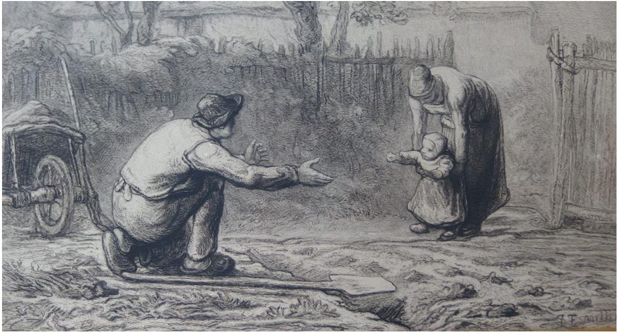
Li mbaġhad irriinterpretahom Van Gogh fix-xogħol tiegħu tal-1890, Le Premiers Pas (d'après Millet)