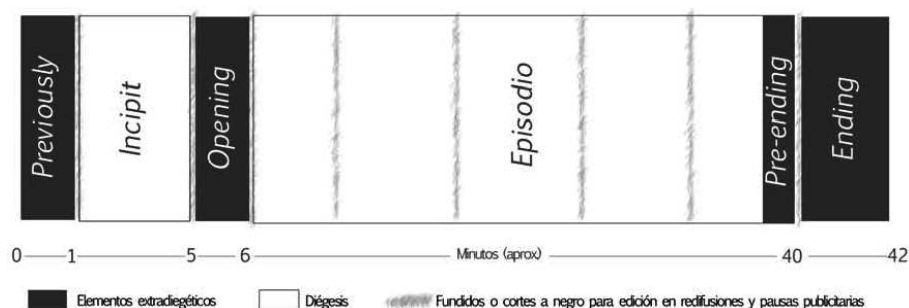
Gráfico 1: Esquema genérico de la estructura de un episodio de una serie dramática televisiva norteamericana del nuevo milenio.