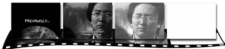
Imagen 1 – Fotogramas del previously del episodio de Héroes: Lo más difícil (#1x21 The Hard part , John Badham, 2007) como ejemplo de previously en cuanto a su explícito reconocimiento visual y su conexión del cliffhanger del último episodio con el incipit del presente mediante fundido a blanco, mecanismo, éste último, utilizado de forma similar en Mujeres desesperadas ( Desperate housewives )