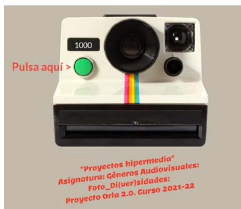
Figura 6. Proyecto multimedia del alumnado de la asignatura 'Géneros Audiovisuales', Curso 2021-22 https://cutt.ly/1lcDEao

Además de los resultados antes citados, Di(ver)sidades ha tenido impacto directo en el alumnado de las siguientes asignaturas pertenecientes a CUATRO titulaciones de la Universidad de Salamanca: Historia de los medios audiovisuales (2º del Grado en Comunicación y Creación Audiovisual), Laboratorio de fotografía (3º del Grado en Comunicación y Creación Audiovisual), Géneros Audiovisuales (3º del Grado en Comunicación y Creación Audiovisual), Género y Sociedad (2º del Grado en Sociología), Investigación responsable y colaborativa (Máster Estudios de la Ciencia, la Tecnología y la Innovación), Procesos creativos de la imagen técnica (Máster