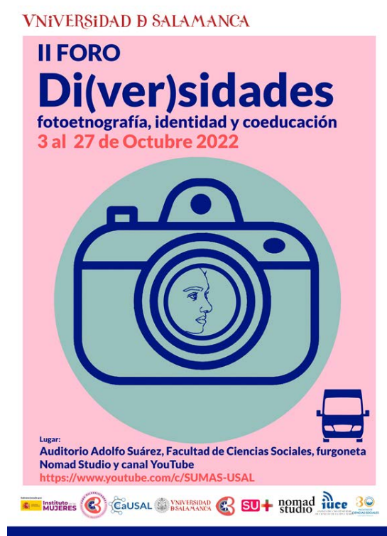
Figura 4. Cartel del II Foro Di(ver)sidades (2022). Elaboración propia

coeducación como uno de los pilares fundamentales de nuestra salud pública y está vertebrado en torno a seminarios presenciales y foros de debate en formato webinar retransmitidos en directo por el canal de YouTube de la Facultad de Ciencias Sociales de la Universidad de Salamanca (USAL). Impulsado por el Grupo de Investigación CaUSAL (Cultura Académica, Patrimonio y Memoria Social), el Foro Di(ver)sidades está concebido como un espacio para la formación que desde la fotografía aborda el debate contemporáneo sobre la identidad de género y la orientación afectivo-sexual introduciendo una perspectiva interseccional. Para conseguir tales fines, el 'Foro Di(ver)sidades' se desarrolla en el contexto del Programa de la Facultad de Ciencias Sociales + FACULTAD, y de forma paralela a FotoC3.