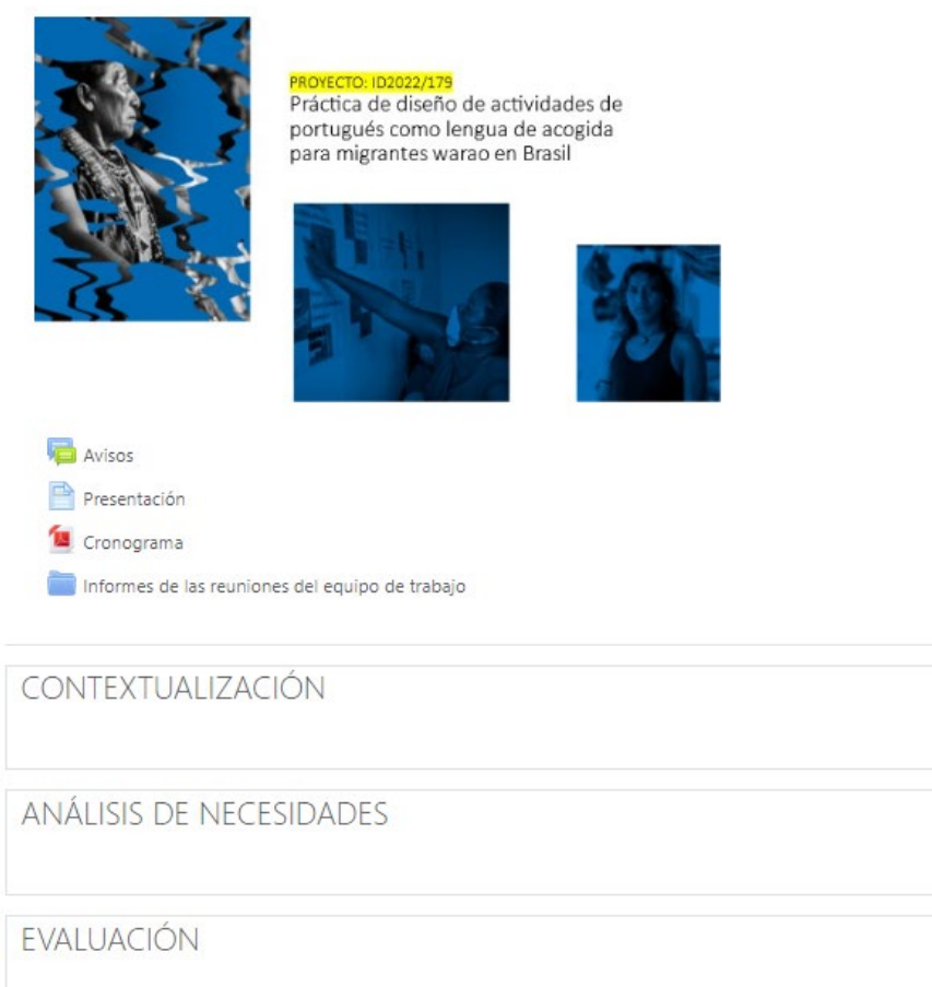
Imagen 1. Espacio en Studium del proyecto.

A continuación, se realizó la presentación del proyecto en el aula, explicando los objetivos y algunas de las nociones que se manejaban tales como ApS, PLAc y ODS (v. Imagen 2), explicando el modo de trabajo (v. Imagen 3).