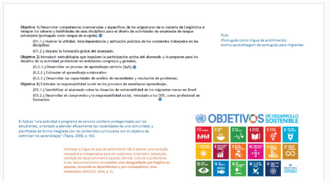
Imagen 2. Diapositiva de objetivos de la presentación del proyecto