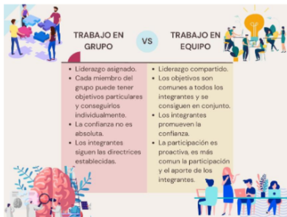
Imagen 3. Diapositiva de modo de trabajo de la presentación del proyecto.

(O.2.3.) Desarrollar las capacidades de análisis de necesidades y resolución de problemas