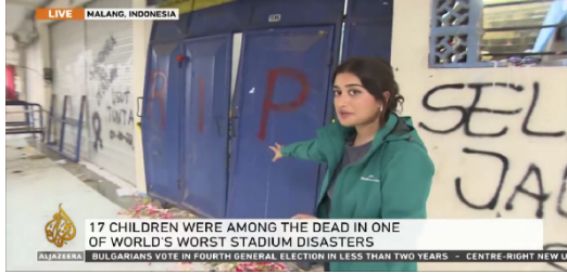
الصورة ٤. صحفيو الجزيرة في ملعب كانجوروهان

جاوة الشرقية. في تقريره المباشر لشبكة الجزيرة التلفزيونية الضوء على حالة الاستاد الذي هلك الرثيث بعد مأساة ليلة السبت.