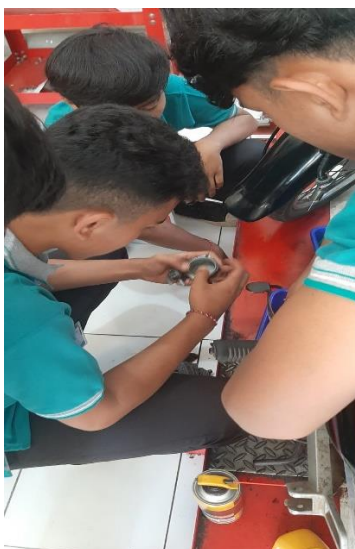
Gambar 4. Pemeriksaan Akhir Tune Up Sepeda Motor