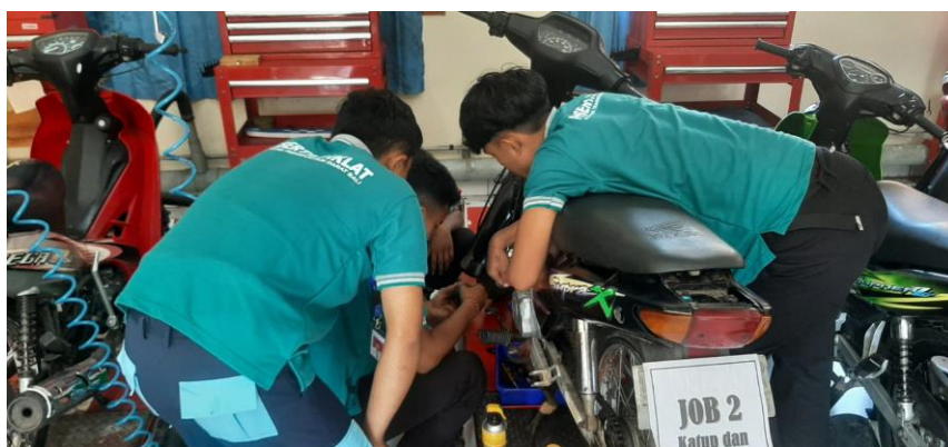
Gambar 2. Pemeriksaan Kelistrikan Sepeda Motor