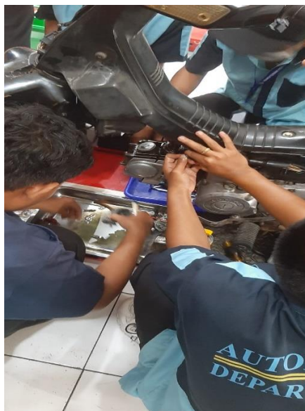
Gambar 3. Pemeriksaan Salah Satu Komponen Mesin (Karbulator)