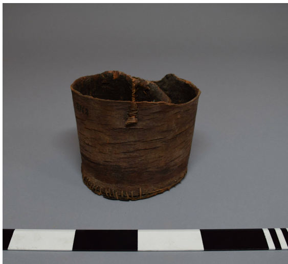
Fig. 2. Recipiente fabricado de corteza (posiblemente Drimys winteri ) y fibras vegetales llevado por C. Skottsberg al Museo Etnográfico Gotemburgo, Suecia.

corteza eran el coigüe ( N. betuloides ), el canelo ( D. winteri ), el maitén ( Maytenus magellanica ), el tenío ( Weinmannia trichosperma ) y el mañiu ( Podocarpus nubigena ), estos dos últimos restringidos biogeográficamente a la zona norte del área de estudio. Para el consumo alimenticio de sustancias dulces de la savia se utilizaba la lenga ( N. pumilio ) (Zárraga, 2017) y el coigüe ( N. betuloides ) (com. pers. de Gabriela Paterito). Los registros existentes, así como la propia fisiología de estas especies, coinciden en que la extracción de corteza era realizada al comienzo de la primavera, cuando los árboles movilizan carbohidratos y nutrientes por el floema desde el sistema radical hacia las ramas superiores para el desarrollo del follaje. La extracción era realizada mediante herramientas cortantes como conchas afiladas y posteriormente con latas o metales afilados, para luego separar la corteza mediante descortezadores de hueso de guanaco o trozos de hueso de ballena labrados en forma de cuña (Orquera & Piana, 1999).