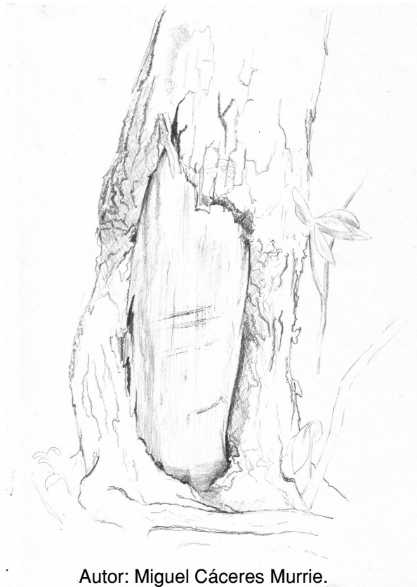
Fig. 3. Ilustración realizada en la desembocadura del río Batchelor de un árbol culturalmente modificado, con cicatriz de descortezamiento y claras marcas del uso de cuña para desprender la corteza del xilema del árbol.

dos por incendios. Algunos de ellos presentan marcas o incisiones claras que sugieren el uso de herramientas cortantes o cuñas para deslizar entre la corteza interna (floema) y el xilema (fig. 3 y 4). Cabe destacar que a la fecha solo existe un registro fotográfico (fig. 4, 5 y 6) de los árboles culturalmente modificados evidenciados en terreno, sin embargo el presente equipo está trabajando por la datación dendrocronológica y registro sistemático de las dimensiones de estas cicatrices.