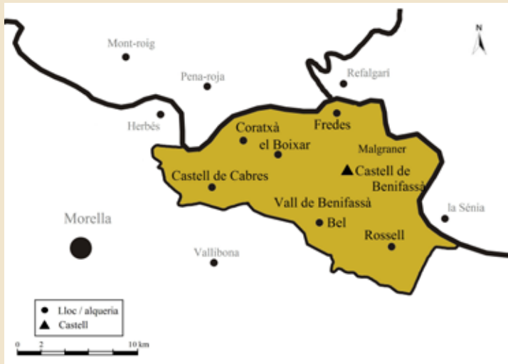
Mapa 2: El castell de Benifassà el 1195 segons la interpretació tradicional.

ha l'excepció del lloc de Coratxà, que queda fora del document del 1233 segurament per una errada de l'escrivà. 41