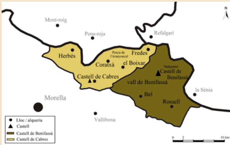
Mapa 3: Els castells de Cabres i Benifassà entre 1195 i 1210.