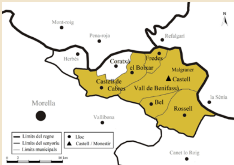
Mapa 1: El castell de Benifassà segons la donació reial del 1233.

El 1232, Blasco d'Alagó encomana a quatre musulmans el reconeixement dels límits del vell castell de Morella i els veedors inclouen dins de les fronteres del hisn tots els territoris assignats al castell de Benifassà per Jaume I. 36 L'argument que deu permetre al noble defensar la validesa d'aquesta partició és que aquesta era la divisió que existia en temps dels sarraïns i que així havia estat plasmat en les cartes de poblament de les viles del sud d'Aragó de la segona meitat del segle XII. Atenent aquestes justificacions i fóra quina fóra la seua adscripció en època andalusina, Alagó també incorpora el castell de Benifassà de manera unilateral en el districte de la vila que es defineix en la carta pobla del 1233, sense consultar als titulars del senyoriu, que són Guillem de Cervera i el monestir de Poblet. 37