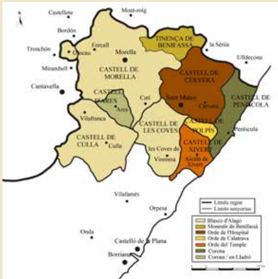
Mapa 4: La xarxa de senyorijs de les comarques dels Ports i el Maestrat entre 1235 i 1239.

són repartits entre els diversos membres de la classe senyorial que participen en la conquesta. 51