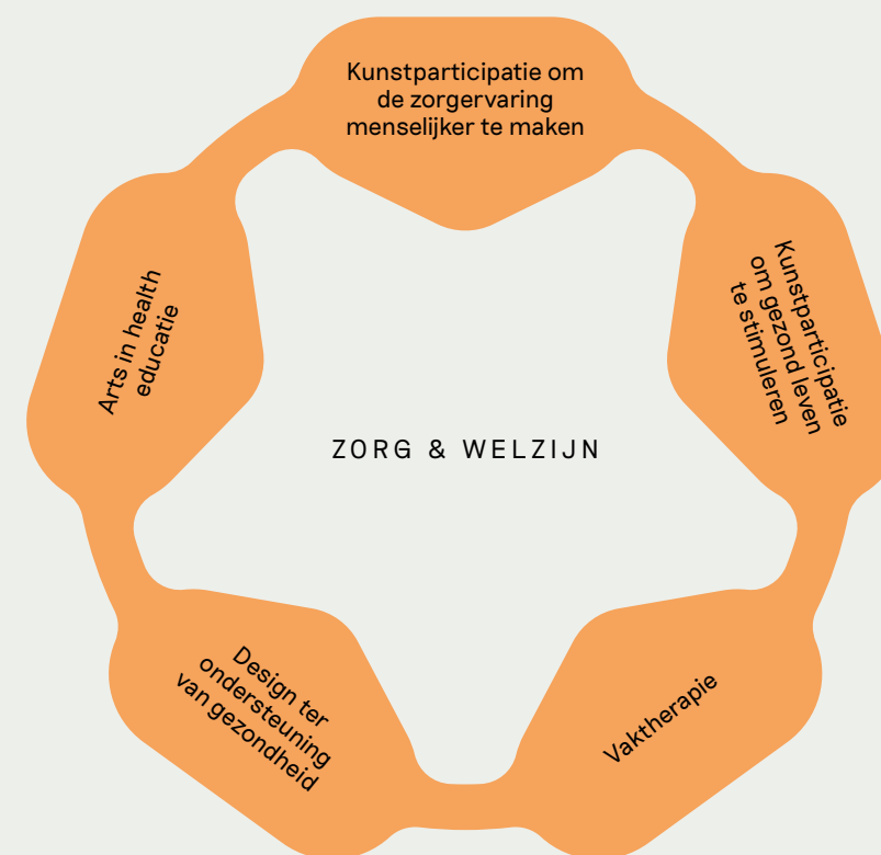
Figuur 2. Een continuüm van arts in health praktijken voor Nederland.