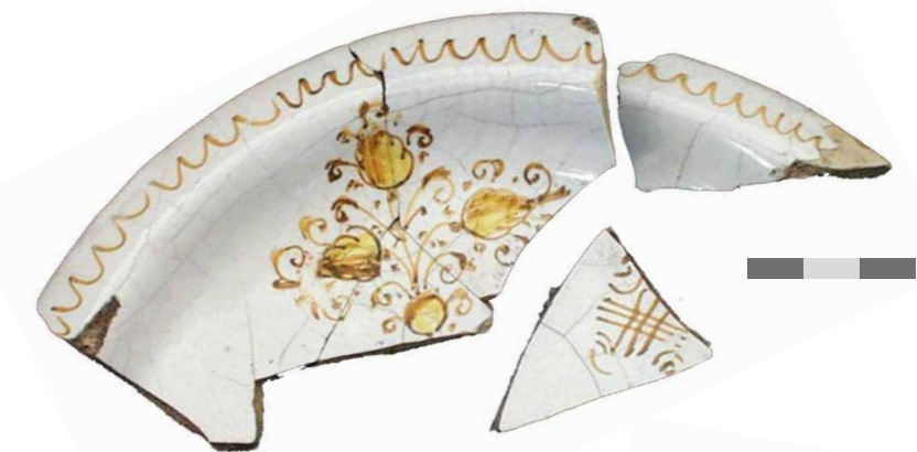
Fig. 3a. Scodella in stile compendiario di Castelli, con cespuglio a foglie bipartite e girali e con semplice linea ondulata sull'orlo. Scavo "Zaandam Hogendijk I" - inv. nr. HD I-21-168.