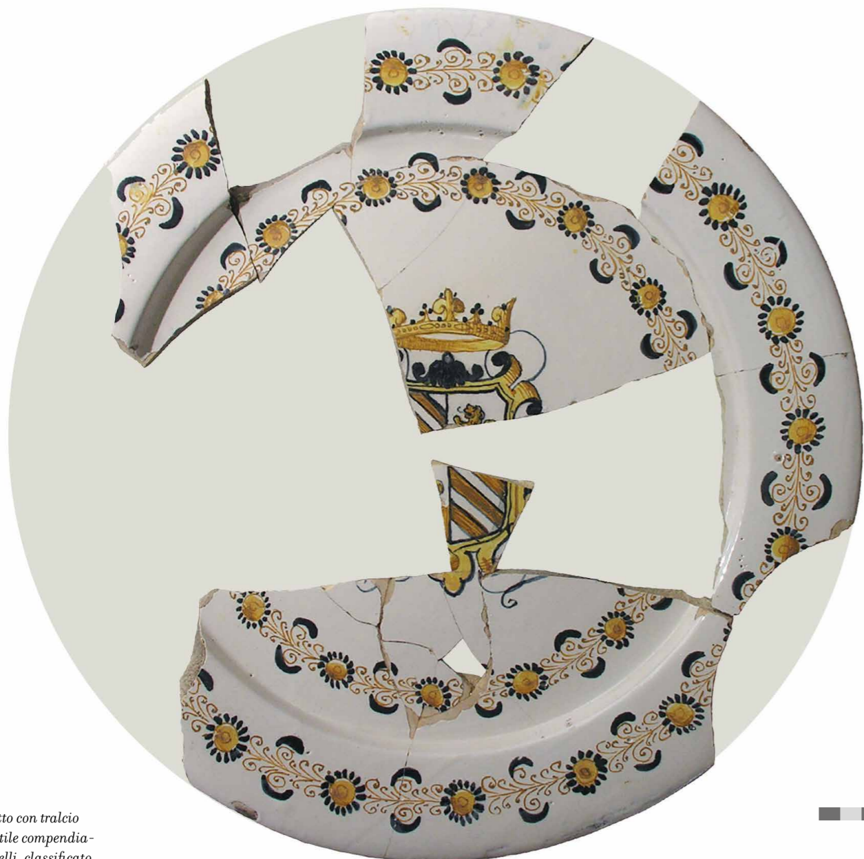
Fig. 4. Piatto con tralcio diritto in stile compendiario di Castelli, classificato come tipo B (ghirlanda con rosette stilizzate e girali), presenta al centro uno stemma araldico. Reperto proveniente da Edam, collezione privata. Lo stemma è identificabile con quello della famiglia D'Aquino, forse riconducibile a Giovanni d'Aquino (morto nel 1664), secondo Principe di Feroleto (Catanzaro) che fu Capitano di cavalleria nelle Fiandre. Questa ceramica, congiuntamente a quella successiva in fig. 5, attesta la presenza in Olanda di uomini d'arme del Regno di Napoli, all'epoca sotto il dominio spagnolo che si recavano, come noto, al soldo degli stessi iberici a combattere nelle Fiandre.

(tralcio diritto con rosette stilizzate e girali) 19 è conosciuta anche grazie agli scavi di Salerno e Vietri 20 . Questo tipo di ghirlanda è datata agli anni '90 del '500 o agli inizi del secolo successivo. Il fiore concepito come il classico fiore di brionia di stampo rinascimentale è un motivo ricorrente nelle maioliche castellane, ma si trova anche nelle maioliche provenienti da Napoli e dalla Puglia. L'esemplare presentato in questa edizione è stato rinvenuto nei dintorni di Edam (Fig. 4). È sorprendente che questo elemento sia stato imitato anche