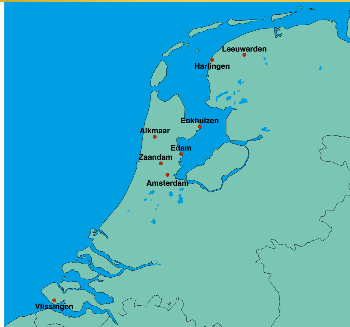
Fig. 1. Elaborazione grafica della mappa dei Paesi Bassi con in evidenza i siti che hanno restituito ceramica in stile compendiario di Castelli.

il commercio dei suoi prodotti, del nuovo stile: il compendiario, nato a Faenza qualche anno prima, ma diffusosi presto in tutta l'Italia centrale. La produzione di Castelli ebbe probabilmente inizio negli anni '60 del '500, prima che negli altri centri del Regno 6 , ma già dagli anni '70 dello stesso secolo lo stile si irradia nei centri attorno e dentro Napoli, a Salerno negli anni '90 ed a Vietri agli inizi del '600 7 , infine in Puglia, a Laterza e Cutrofiano 8 . Dato che lo stile decorativo prodotto da questi ultimi era pressoché identico a quello castellano, anche per effetto del trasferimento delle stesse maestranze abruzzesi, oggi la distinzione precisa tra le varie ceramiche risulta non facile. Per