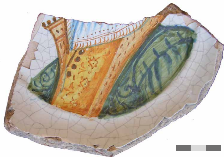
Fig. 6. Piatto con ritratto in compendiario di Castelli d'Abruzzo, primo quarto del sedicesimo secolo. Scavo Enkhuizen De Baan I, reperto senza contesto. Collection Provinciaal Archeologisch Depot Noord-Holland (inv.nr. 6008-026-001).

La maiolica olandese in stile compendiario è principalmente influenzata dalla versione ligure di questa particolare tipologia, a dimostrazione di questo, il compendiario ligure è quello più frequentemente attestato negli scavi olandesi, forse perché più esportato e quindi più utilizzato. Tuttavia, ci sono anche delle varianti che dimostrano come anche le tipologie del Sud Italia hanno influenzato la produzione olandese, come ad esempio i fiori presenti nelle ghirlande di tipo B (vedi infra Fig. 2) attestati sulla scodella in Fig. 7. È singolare che i pittori di maioliche olandesi utilizzassero questo elemento 33 in quanto gli esempi del Sud Italia sono allo stato attuale degli studi estremamente rari tra i reperti archeologici olandesi. La fonte di ispirazione però fa pensare che questi prodotti fossero in circolazione in un numero più rilevante.