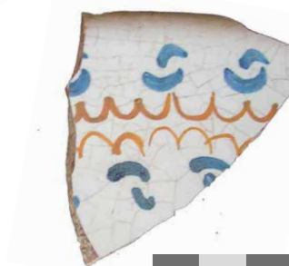
Fig. 3b. Catino in stile compendiario di Castelli, con ornato "a smerlo" o linea ondulata con fiore stilizzato. Scavo "Enkhuizen De Baan I" - inv. nr. 6008-022-001.