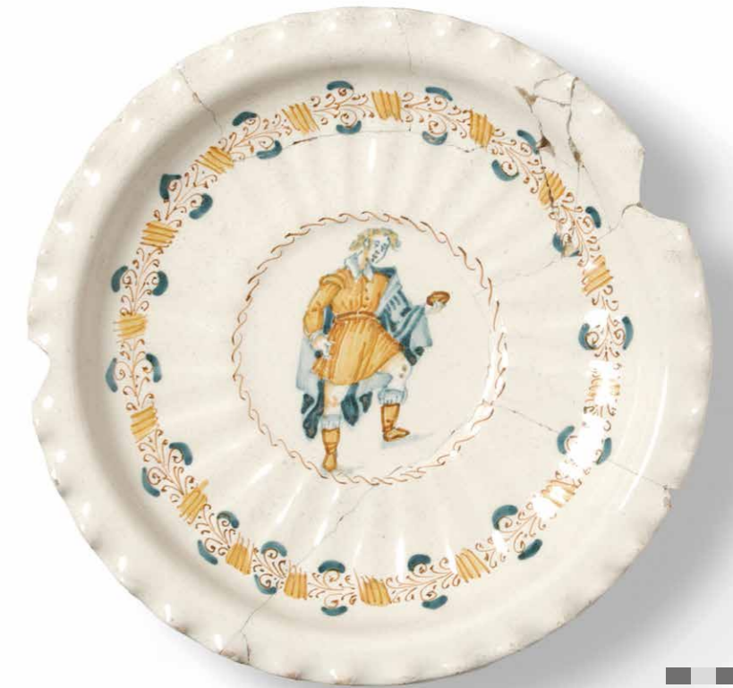
Fig. 2. Piatto con tralcio diritto in stile compendiario di Castelli, classificato come tipo A (ghirlanda con nastri e girali) e figura umana al centro. L'ornato è stato rinvenuto ad Amsterdam e Enkhuizen fra cui il piatto il oggetto.

La ghirlanda floreale di Tipo B di origine castellana, classificata come gruppo 1a