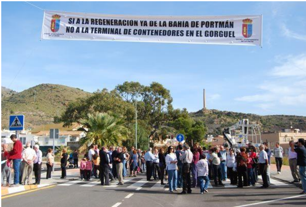
Figura 10: Imagen de la Pancarta con el lema “Sí a la regeneración en la bahía de Portmán, No a la terminal de contenedores en el Gorguel”