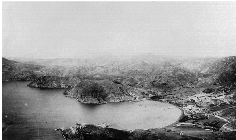
Figura 1: Imagen aérea de la bahía de Portmán

De acuerdo con Baños-González y Páez-Baños (2013, p.13) «las bahías son sistemas geomórficos naturales de gran interés desde diversos puntos de vista: Científico, ambiental, educativo, didáctico, recreativo, turístico, etc.». En este estudio, nos interesa este último ámbito mencionado. Es más, ambos autores expresan la riqueza de la bahía de Portmán, definiendo la Bahía como un enclave con valioso patrimonio cultural y rico recorrido histórico.