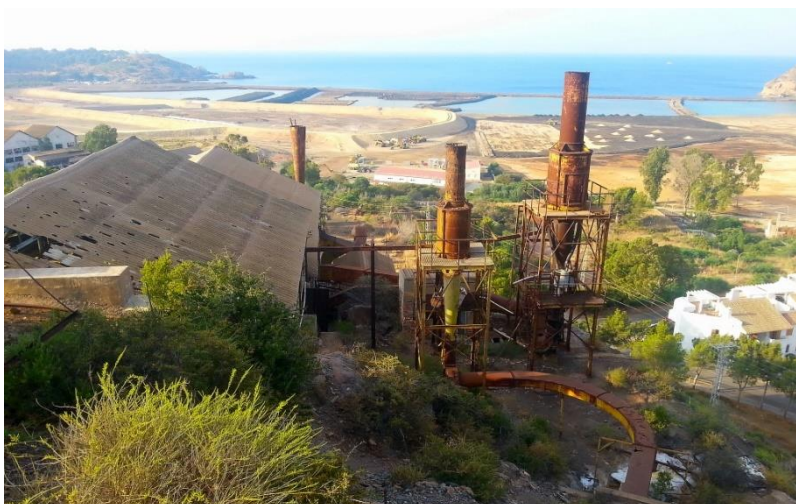
Figura 11: Imagen de las vistas a la Bahía de Portmán desde el Lavadero Roberto