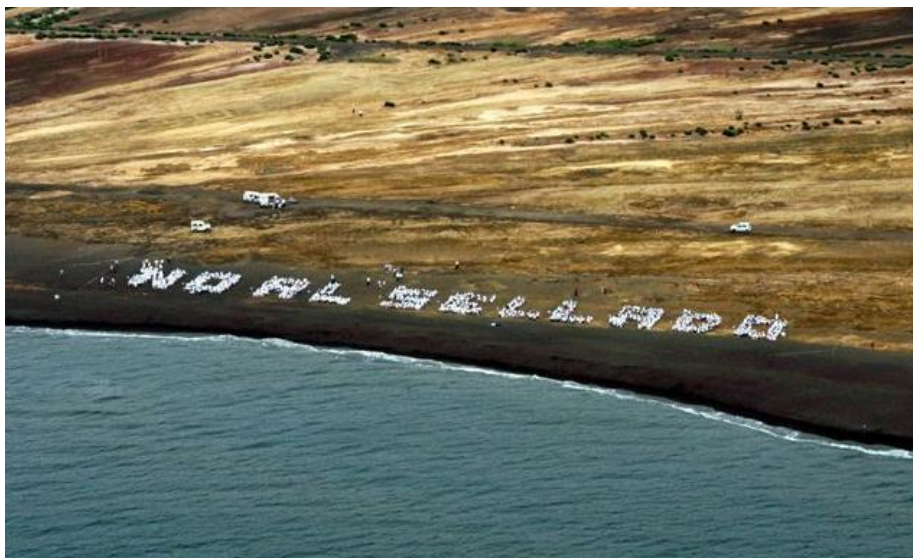
Figura 9: Pancarta Humana que forma la frase “No al sellado” en la playa de San Bruno, Portmán”.

la intención del Ministerio de Medio Ambiente de sellar la bahía de Portmán para lograr la regeneración de esta. Esto causó un gran revuelo entre los vecinos. El sellado de la Bahía planteaba cubrir las arenas de estériles con tierras calizas y posteriormente con una malla geotextil, además de la creación de una escollera en la línea de costa. De esta manera, las aguas no entrarían en contacto con los estériles y se mantenía la línea de costa. Desde un punto de vista ambiental y económico, esta opción no suponía grandes esfuerzos. Sin embargo, no fue aceptada por los vecinos al no contemplar los objetivos que pretendían para la recuperación y adecuación ambiental de la Bahía.