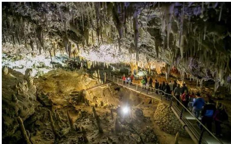
Figura 3: Imagen de la Cueva El Soplao, en el Territorio Minero El Soplao

Otro claro ejemplo de aprovechamiento del patrimonio minero es el de Cantabria, donde la minería que comenzaba en época romana y seguía con fuerza en los años 40 del siglo XIX, ha dejado multitud de ejemplos de elementos patrimoniales en espacios mineros repartidos por la región: espacios de extracción a cielo abierto, lavaderos, infraestructuras portuarias, viviendas de trabajadores propias de la zona, equipamientos educativos, sanitarios, religiosos, etc. y depósitos de estériles, entre otros. Todos estos recursos recuperados de la minería suponen la base para una nueva orientación económica de la región cántabra, donde ya se han creado productos turísticos basados en la minería, como el Territorio El Soplao (Figura 3). Además, hay una serie de proyectos que también pretenden darle un nuevo uso a los espacios mineros en la región. (Cueto Alonso, 2009)