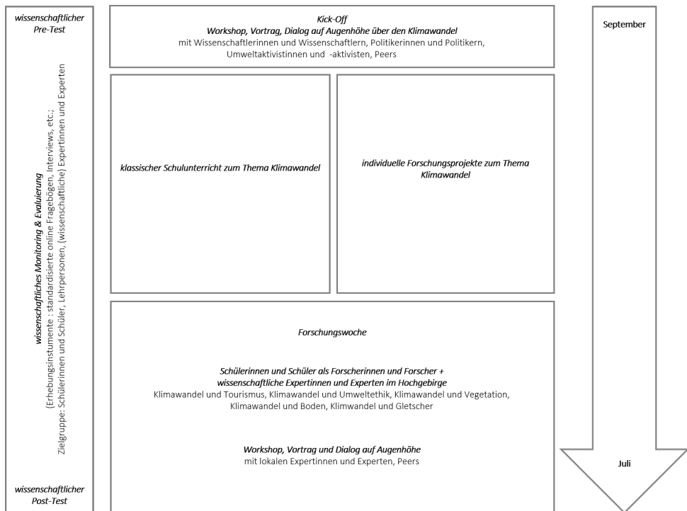
Abb. 1: (Transdisziplinäre) Module in k.i.d.Z.21

nis des Lernens zugrunde (Basten et al., 2015). Inzwischen besteht eine Kooperation zwischen Schulen in Tirol, Oberösterreich und Bayern sowie (wissenschaftlichen) Expertinnen und Experten verschiedener Disziplinen. Bereits über 2.500 Schülerinnen und Schüler waren Teil von k.i.d.Z.21. Ziel der Zusammenarbeit ist die Bewusstseinsbildung in Bezug auf den Klimawandel und dessen Folgeerscheinungen. Darüber hinaus sollen teilnehmende Schülerinnen und Schüler im Hinblick auf ihre Handlungs- und Anpassungsfähigkeit für zukünftige Herausforderungen gestärkt werden (Keller et al., 2019; Stötter et al., 2016).