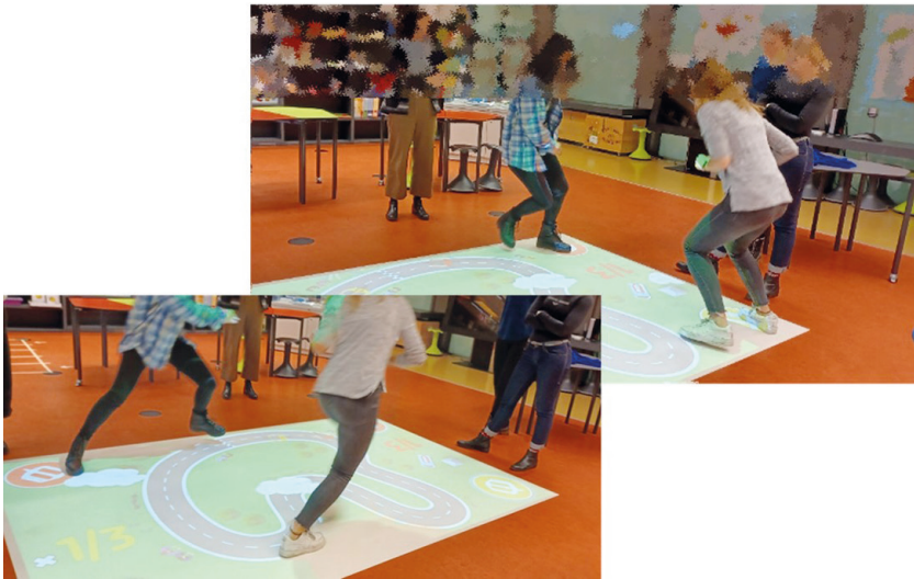
Abb. 2: Computergestützte Interaktion zwischen den Spieler:innen