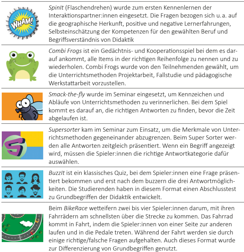
Tab. 2: Inszenierung der Spiele im Seminarzusammenhang. Icons entnommen aus https://files.activefloor.com/docu/myfloor/game_manual_en.pdf (zuletzt geprüft am 13.07.2023)

Im analysierten Seminarsetting dient das digitale Medium ActiveFloor zur Gestaltung einer Lernumgebung. Durch die Repräsentation mechanischer, dynamischer und ästhetischer Merkmale eines Computerspiels bietet der ActiveFloor ein gamifiziertes Lernsetting. Nach dem Login auf der Online-Plattform, können die Akteur:innen eine Spielvorlage auswählen. Dabei können sie über das Spieltemplate die Interaktionsmöglichkeiten bestimmen und die zu vermittelnden Fachinhalte adressatenspezifisch anpassen. Über eine an der Decke montierte Box wird die am Laptop konzipierte Spielidee auf den Boden projiziert. Der eingebaute Tracker registriert die Bewegungen auf dem Spielfeld.