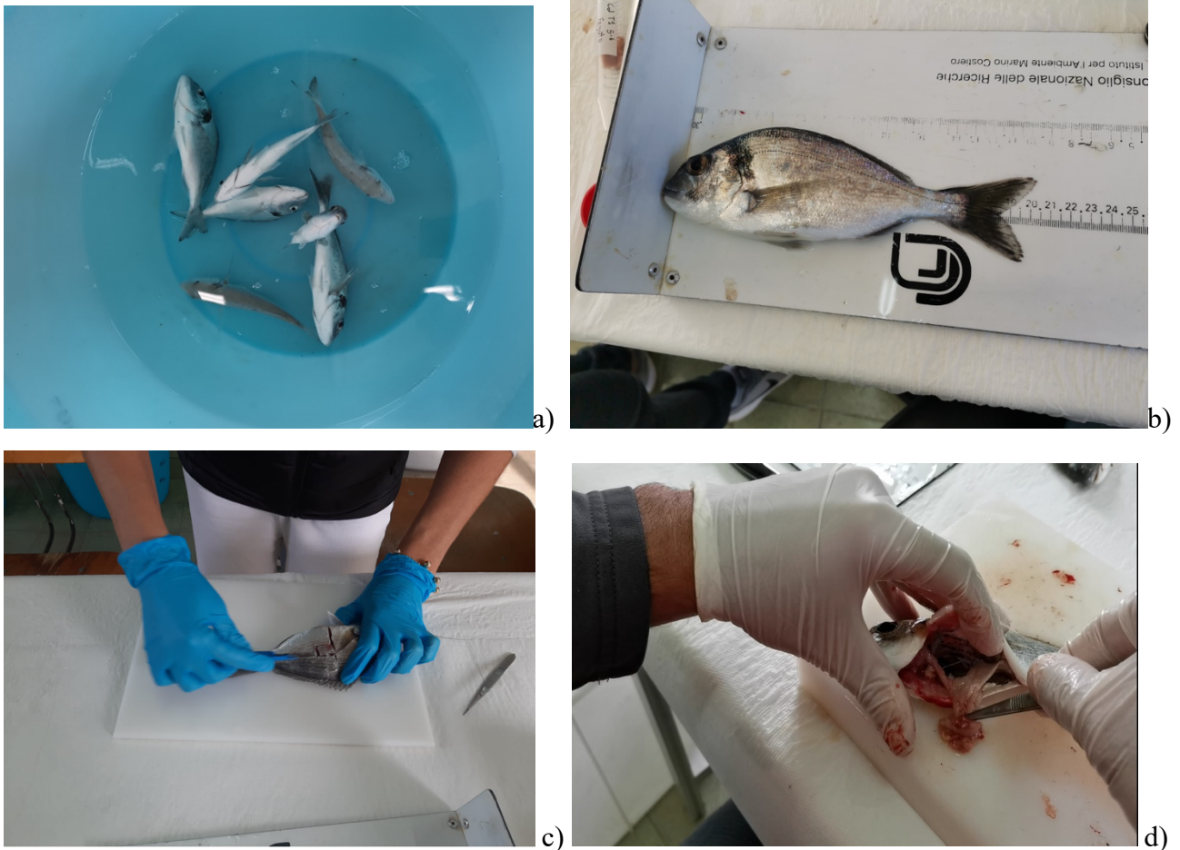
Figura 4: Procedure di sacrificio (a), acquisizioni biometrie (b) e prelievo di tessuti ed organi (c, d) negli esemplari di S. aurata .

Aliquote dei tessuti/organi prelevati sono stati opportunamente conservate a -20^{\circ}\text{C} per l'analisi dei contaminanti ed a -80^{\circ}\text{C} per indagini volte alla valutazione di meccanismi molecolari e di risposta metabolica conseguenti allo stress indotto da contaminanti e meccanismi di detossificazione e adattamento.