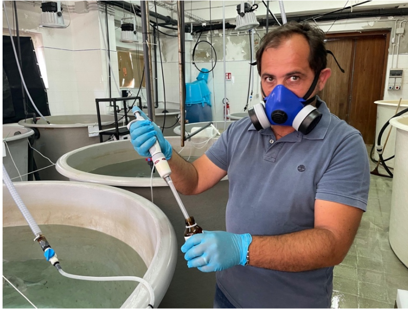
Figura 3: Somministrazione del contaminante in vasca.

Ogni giorno è stato effettuato un ricambio del 10% del volume totale della vasca (100 litri) con contemporanea rimozione (per aspirazione) dei rifiuti organici. Dopo ogni ricambio parziale d'acqua la concentrazione di Hg è stata mantenuta costante mediante somministrazione di dosi aggiuntive di standard del metallo. Aliquote di acqua di mare sono state prelevate nel corso di tutta la sperimentazione per la verifica delle concentrazioni di Hg nel tempo.