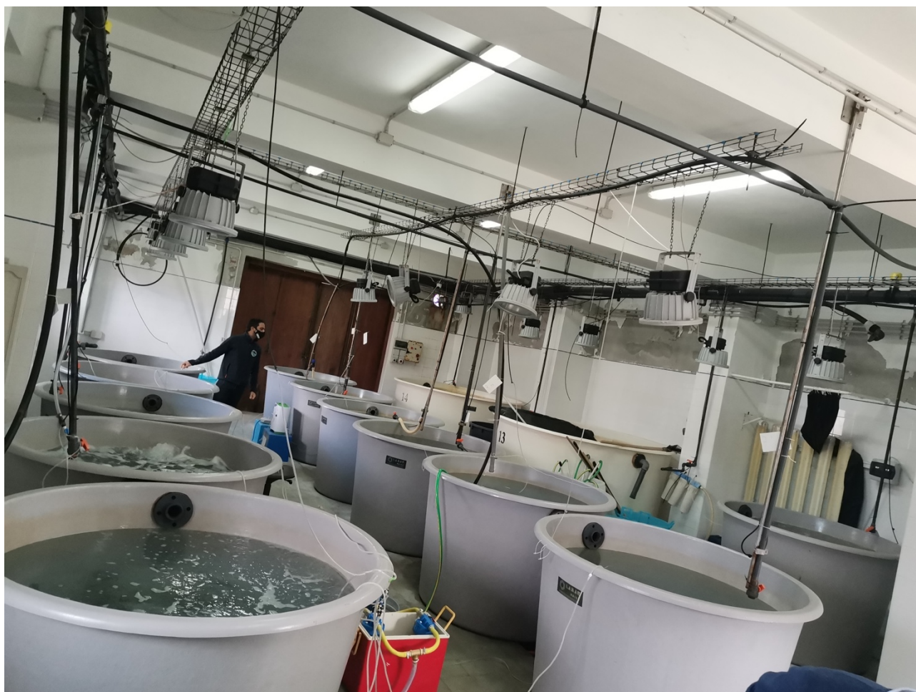
Figura 1: Impianto Sperimentale di Acquacoltura – Istituto per le Risorse Biologiche e le Biotecnologie Marine (IRBIM) - Consiglio Nazionale delle Ricerche

Il protocollo sperimentale di seguito descritto è stato autorizzato dal Ministero della Salute (Autorizzazione n° 707/2021-PR).