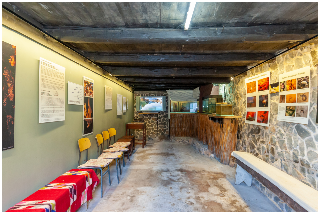
Slika 2. | Edukativni centar Congeria