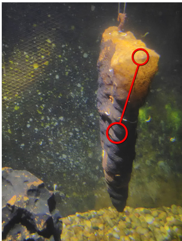
Slika 5. | Označeno kretanje duljine 5 cm jedinke C. kusceri stavljene na stalaktit okomito obješen u akvariju.