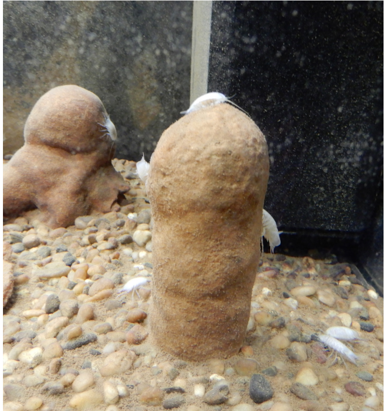
Slika 8. | Špiljske orijaške vodenbabure Sphaeromides virei u drugom akvariju