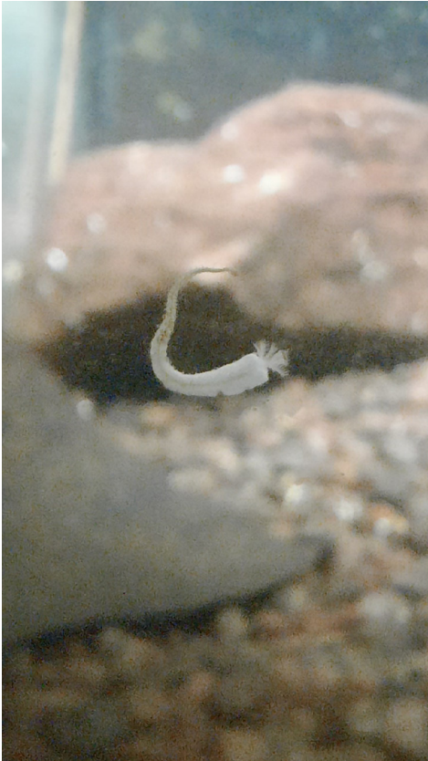
Slika 7. | Dinarski špiljski cjevaš na staklu akvarija