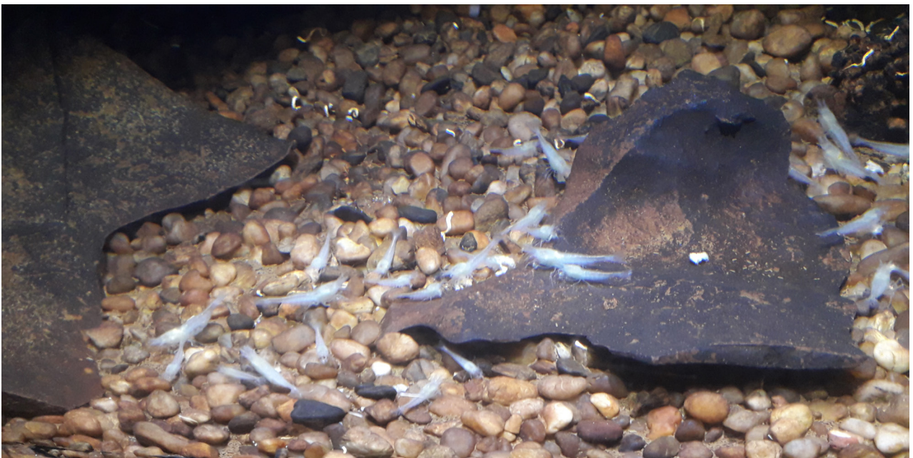
Slika 9. | Špiljske kozice Trogloniscus neglecta u prvom akvariju

vodenbabure S. virei (slika 8), koja je također prava podzemna vrsta, izlaganje svjetlosti ne uzrokuje nikakve primijećene reakcije. Do sada nije zabilježeno njihovo razmnožavanje u akvarijima.