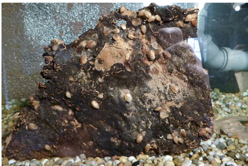
Slika 3. | Centralna stijena u prvom akvariju s vidljivim jedinkama špiljskog školjkaša i dinarskog špiljskog cjevaša na dan postavljanja 2014. godine.

Krajem 2014. došlo je do još jedne dotad nezabilježene situacije u Jami, a time i u akvarijima. U jezери se pojavila velika nakupina čestica smeđe boje i došlo je do pada koncentracije kisika u samom jezeru Jame u Predolcu. To je potvrđeno mjerenjem razine kisika od strane djelatnika Javne ustanove za upravljanje zaštićenim dijelovima prirode Dubrovačko-neretvanske županije, koji su uzorak kontaminirane vode odnijeli na analizu. Nažalost, do danas nije dobivena povratna informacija o čemu se radi niti mogući uzrok nakupljanja. Kako bi se stanje u akvarijima normaliziralo, iz njih se