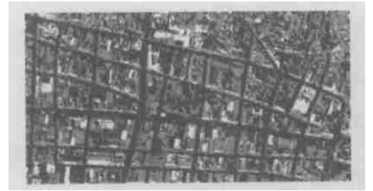
图 2 图 1 的形态分割结果