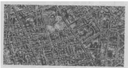
图6 另一幅影像提取出来的道路网络与原始图像重叠的结果