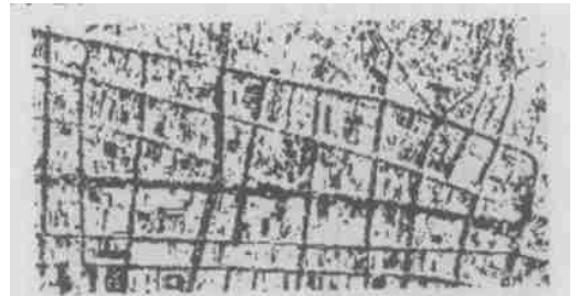
图 3 图 2 的二值化影像

这样就得到一个二值化图像(图 3)。二值化图像较好地表示了原影像上的道路网络轮廓。