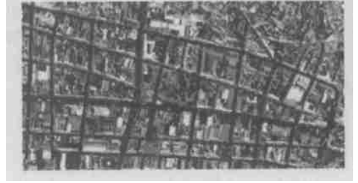
图 1 一个 1 m 分辨率卫星遥感影像

像素。这种选取的依据是基于处理影像的目标特征主要是道路网络特征, 以及试验分析的结果。通过图 2 可以发现, 利用选取的结构元进行形态特征分割, 相关的区域基本上能够正确地检测出来。