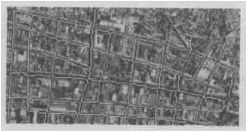
图5 提取出来的道路网与原始图像(图1)重叠的结果

为了说明本文方法的效果,把提取出来的道路网络(图4)与原始图像(图1)重叠,结果如图5。