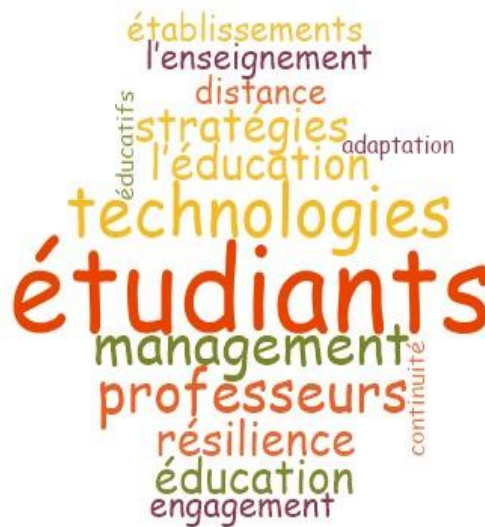
Fig. 5. Nuage des mots les plus fréquents

Source : Elaboré par nos soins à l'aide du logiciel NVivo 10