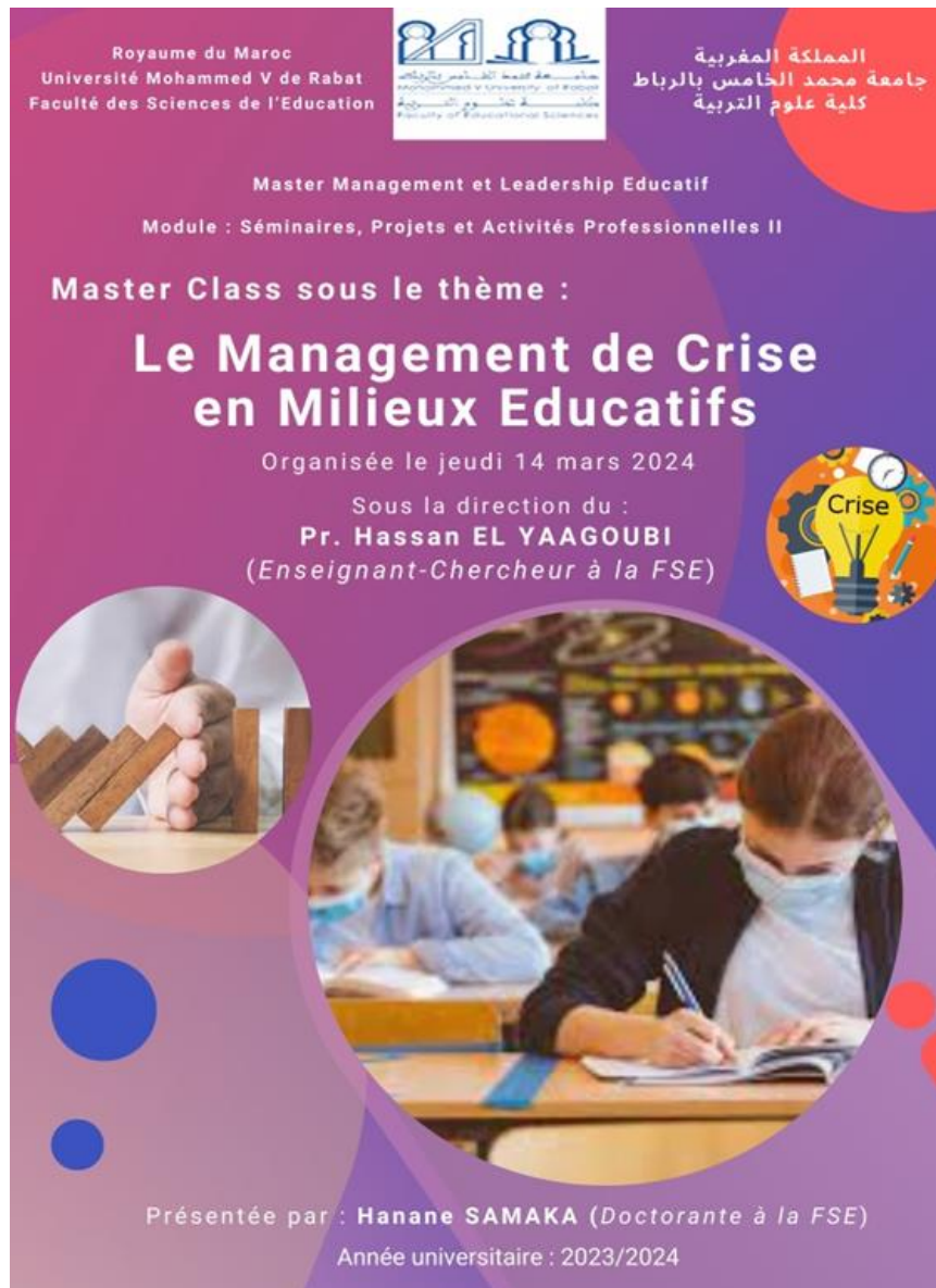
Fig. 3. Affiche de la Master class

Avant de commencer cet évènement éducatif, une affiche annonçant le cadre institutionnel de la Master class, a été élaborée puis diffusée auprès de notre « Focus group », afin préparer leurs réflexions et interventions. (Voir figure ci-après)