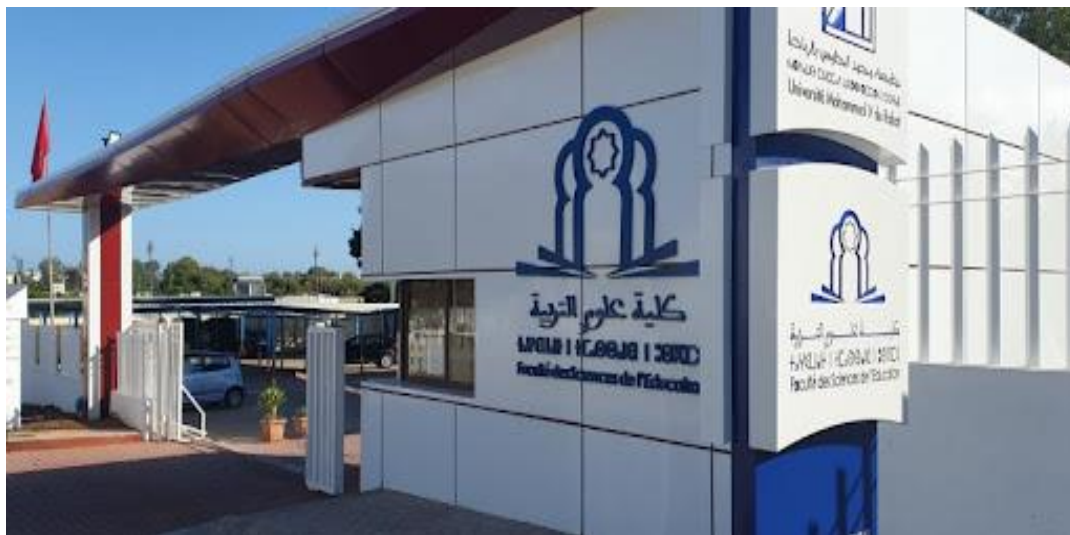
Fig. 2. Faculté des Sciences de l'Éducation de Rabat, Maroc

D'après son Doyen : « La FSE se veut une Faculté engagée et responsable, qui entend prendre toute sa place dans la diffusion du savoir » (Kidai, A., 2020).