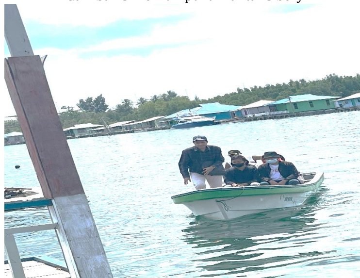
Gambar 6. Penyebrangan ke Kampung Enggros

Kegiatan ke-dua yang dilakukan oleh para Dosen FMIPA masih tetap mengajar penggunaan Microsoft word tentang dasar-dasar, pengeditan teks, pengaturan font, pengaturan paragraph, pembuatan list atau daftar, pengaturan halaman dan kertas, dan mengetik Sebuah artikel dan berita harian. Pemberian materi di lakukan oleh Mahasiswa/i dari Fakultas Teknik Jurusan Planologi yang sedang melaksanakan PKL di Kantor LSM EcoNusa. Pendampingan serta pengajaran tentang Ms. Word tersebut dapat di lihat pada Gambar di bawah ini.