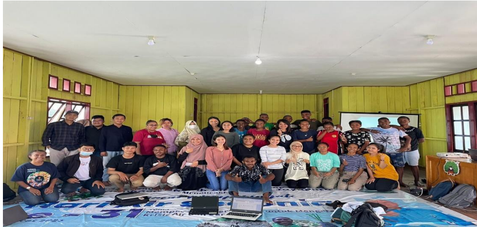
Gambar 8. Pemateri dan Pendamping Pengajar dalam Kegiatan yang ke-2