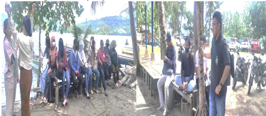
Gambar 5. Berkumpul di Pantai Cibery