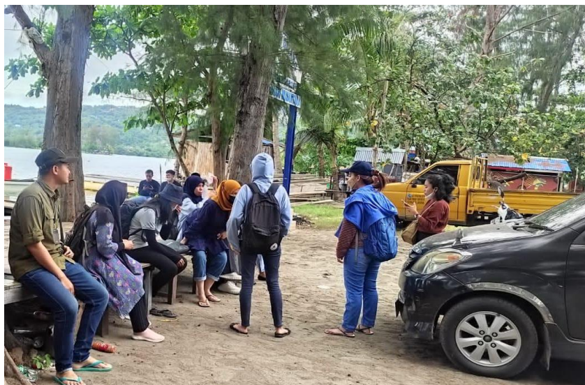
Gambar 2. Tiba di Pantai Cibery