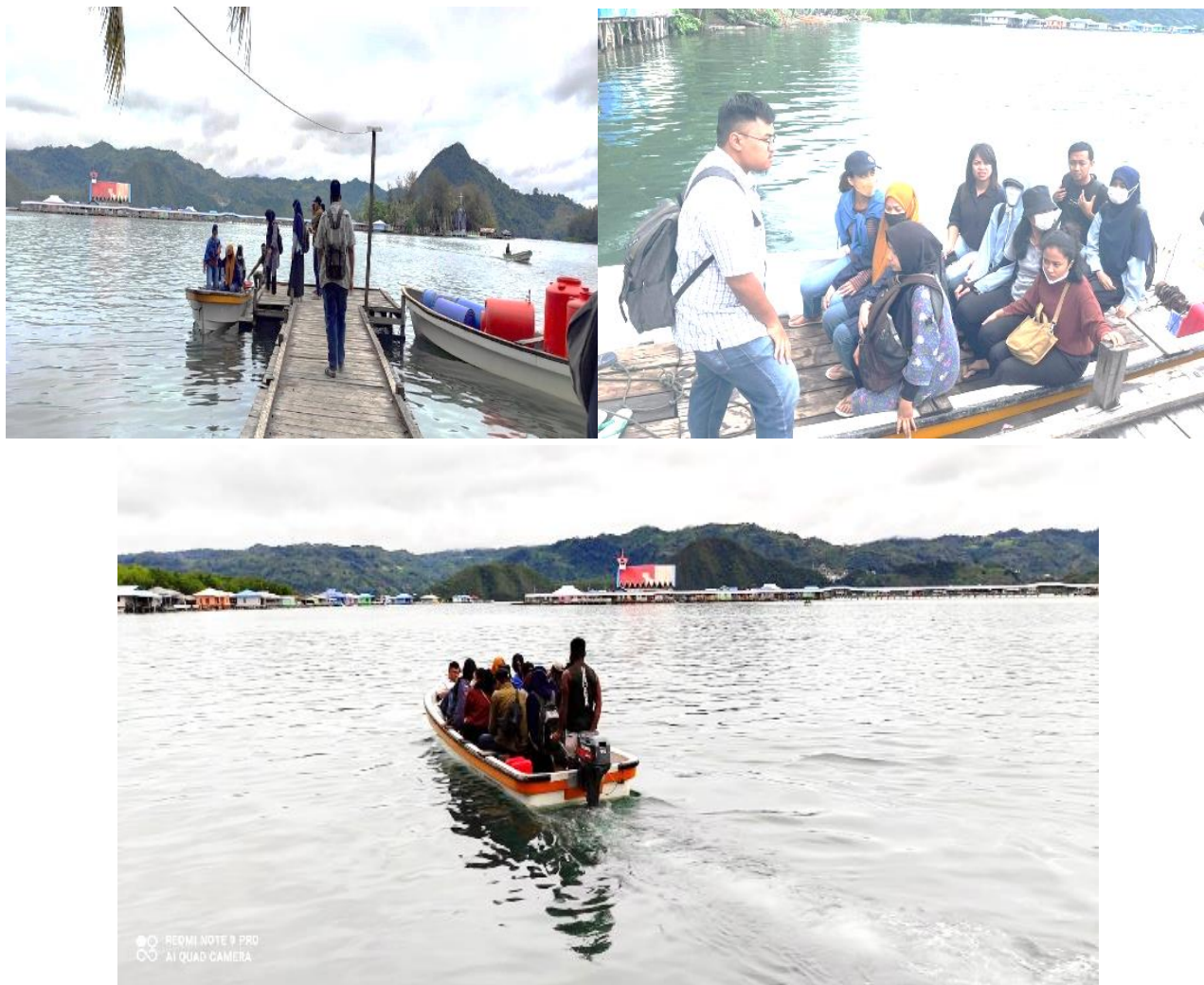
Gambar 3. Penyebrangan menggunakan speedboat ke Kampung Enggros

Setelah tiba di Kampung Enggros, kegiatan yang pertama dilakukan yaitu pembukaan dari pihak Eco Defender dengan menyambut para pemateri maupun pengajar. Materi yang disampaikan tentang penggunaan Microsoft word yaitu pengenalan tentang tools yang ada di Ms.word tersebut serta fungsinya, mengajarkan cara mengetik dan membuat paragraf tentang “Kisah Petani Kakao di Papua” serta cara mengetik surat undangan TNI AL Komando Armada III tentang “Peresmian Kenaikan Pangkat”. Pendampingan serta pengajaran tentang Ms. Word tersebut dapat dilihat pada Gambar 4.