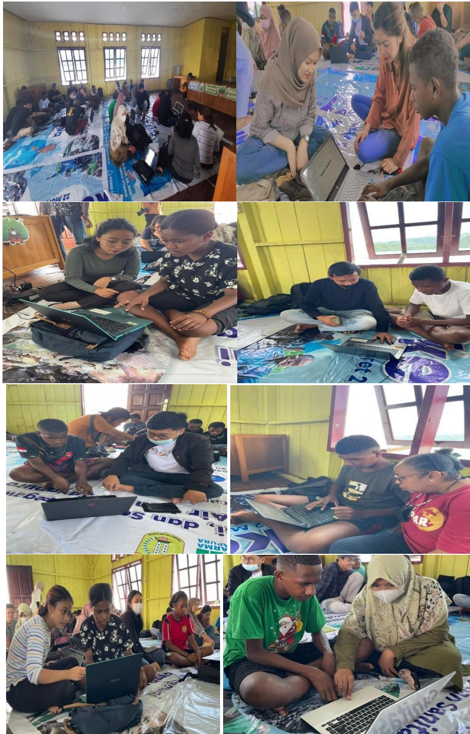
Gambar 7. Meminjam Leptop dan Mengajar Siswa/i SMP