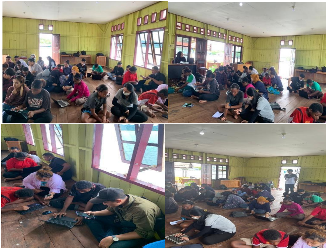
Gambar 4. Mendampingi dan mengajari anak-anak SMP tentang Ms.word