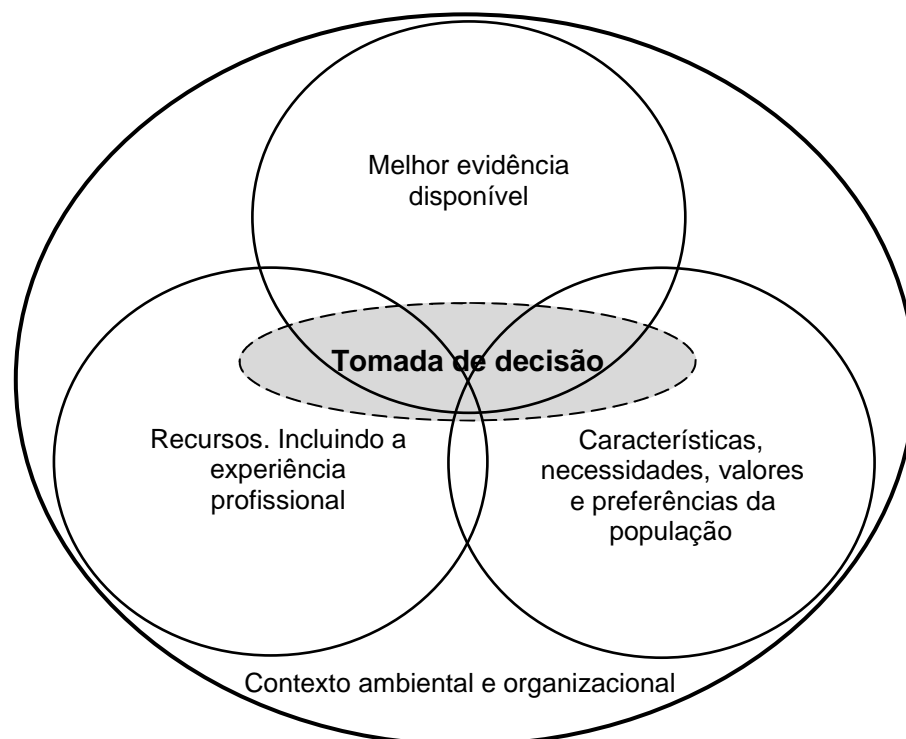
Figura 2 – Combinação de evidência, valores, recursos e contextos que devem integrar o processo de tomada de decisão na SPBE (43).

O processo de tomada de decisão em saúde pública é complexo devido à multidisciplinaridade desta área, com o envolvimento de diversos contributos e de decisões em grupo. Existe um consenso generalizado entre investigadores e especialistas dos diferentes domínios da saúde pública que o processo de tomada de decisão baseado na evidência deve contemplar: 1) a melhor evidência disponível; 2) experiência profissional e outras habilitações; e 3) características, necessidades, valores e preferências dos sujeitos alvo da intervenção (31).